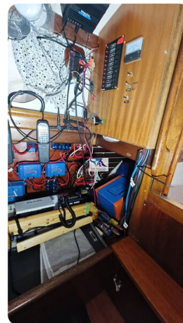
Marken II_msp797539 99