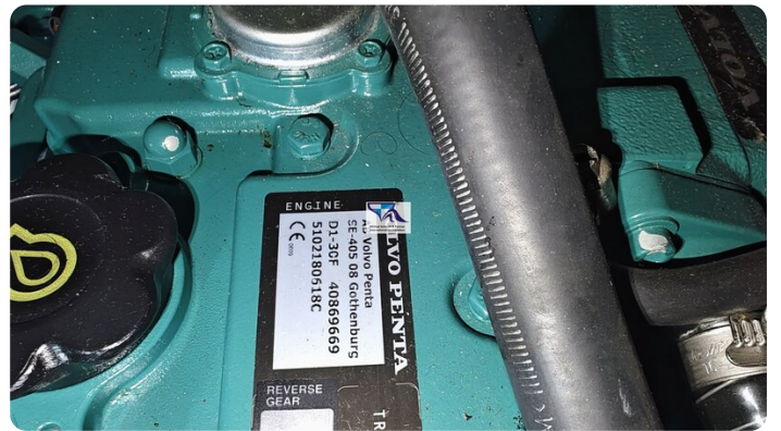
Marken II_msp797539 121