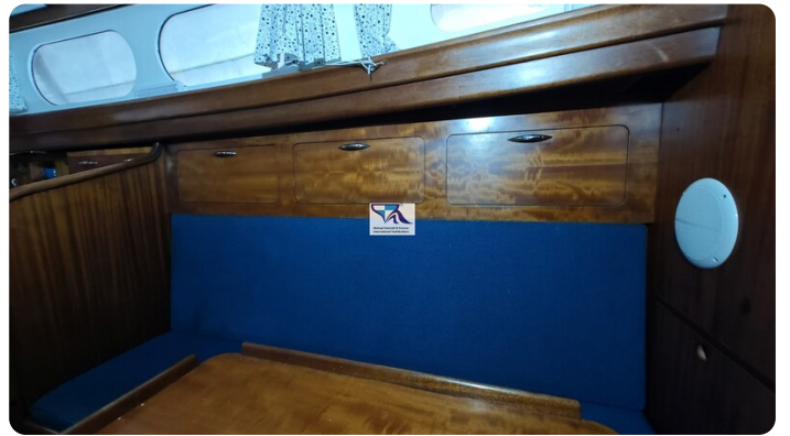
Marken II_msp797539 95