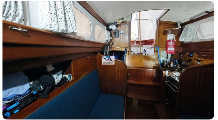
Marken II_msp797539 91