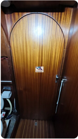
Marken II_msp797539 108