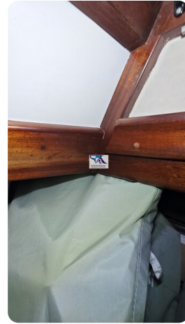
Marken II_msp797539 115