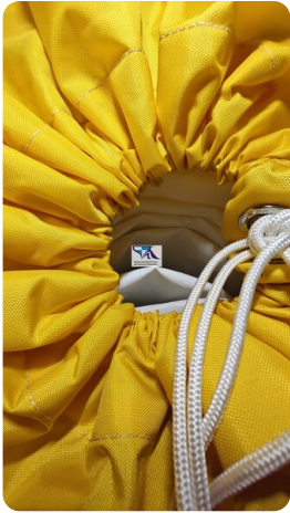
Marken II_msp797539 110