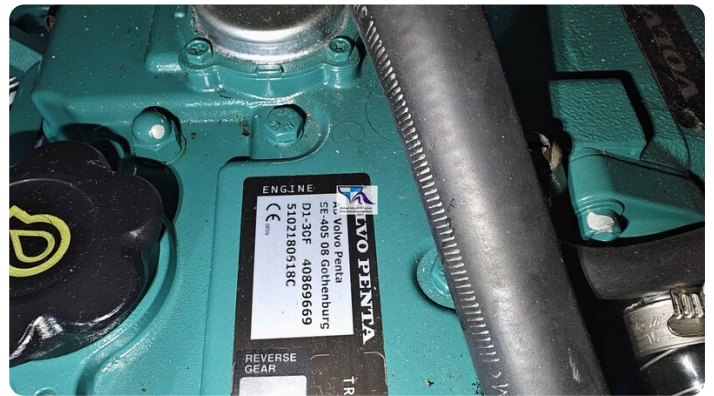
Marken II_msp797539 121