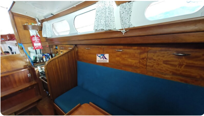
Marken II_msp797539 90