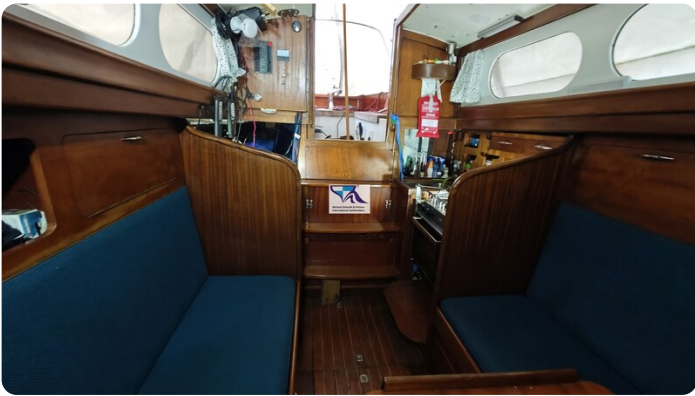
Marken II_msp797539 92