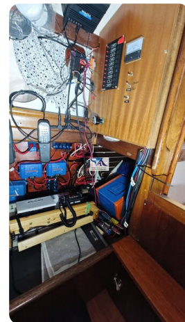
Marken II_msp797539 99