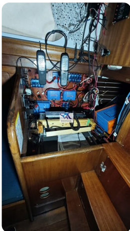
Marken II_msp797539 98