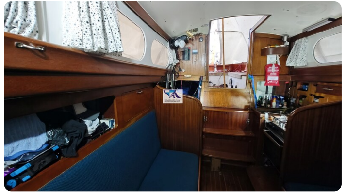
Marken II_msp797539 91