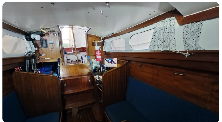
Marken II_msp797539 89