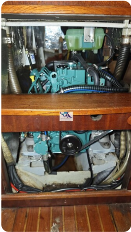
Marken II_msp797539 118