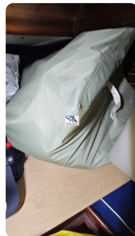
Marken II_msp797539 111