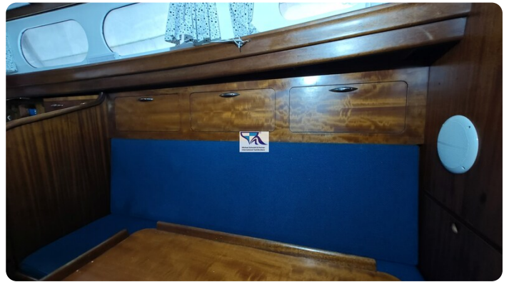
Marken II_msp797539 95