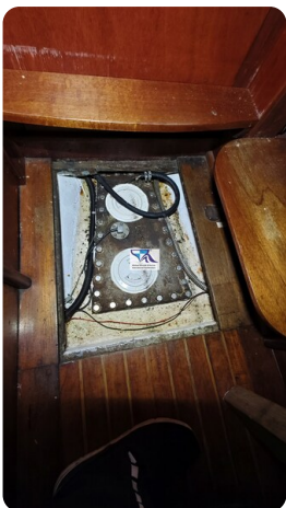
Marken II_msp797539 97