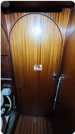
Marken II_msp797539 108