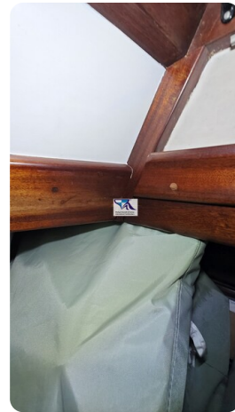
Marken II_msp797539 115