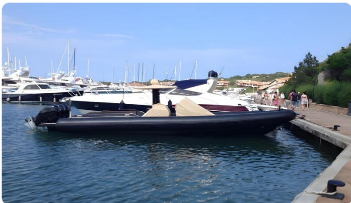
Dariel DTS Profile