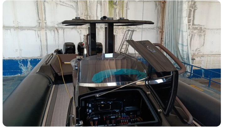
Dariel DTS T-top