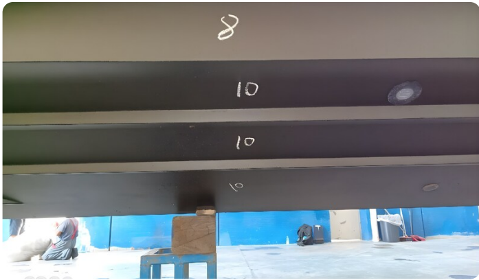
Dariel DTS Hull Detail