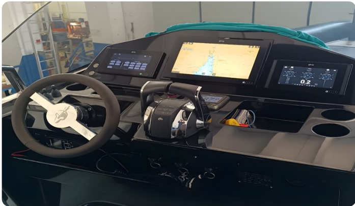
Dariel DTS Console