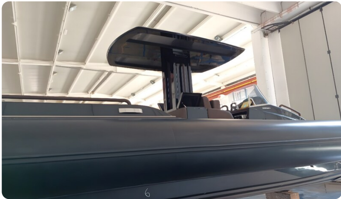
Dariel DTS T-top Detail