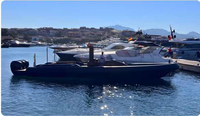
Dariel DTS stbd Profile