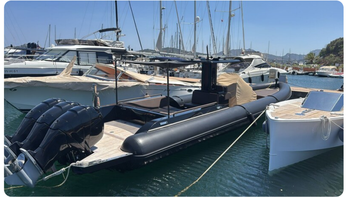
Dariel DTS Aft Profile