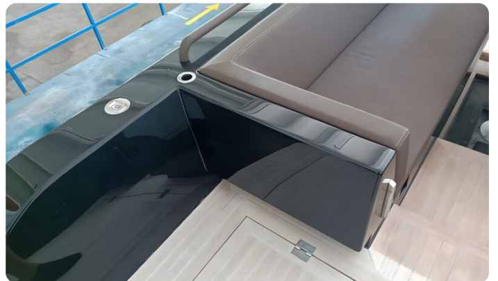
Dariel DTS Sofa Detail