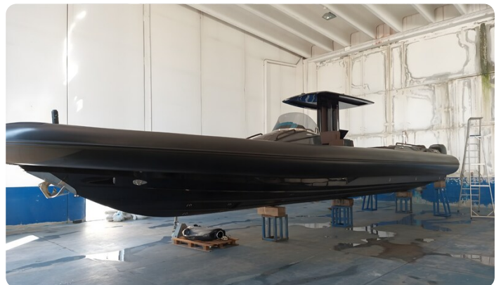
Dariel DTS port Profile