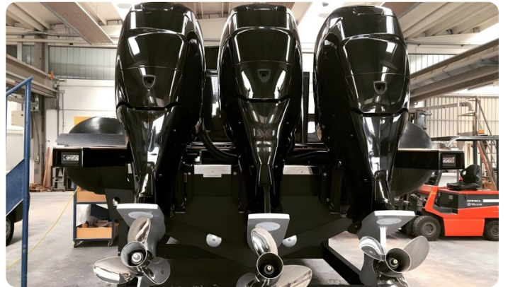
Dariel DTS Engines