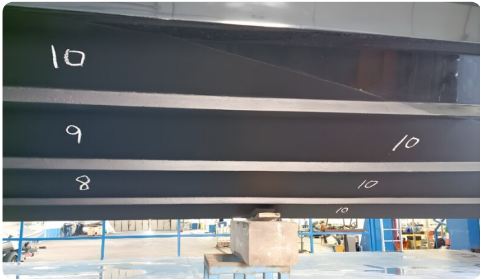
Dariel DTS Hull