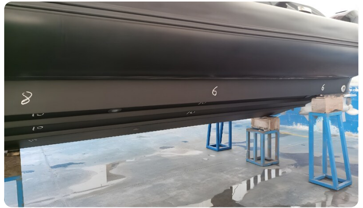
Dariel DTS Port Hull