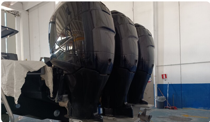
Dariel DTS Engines Detail