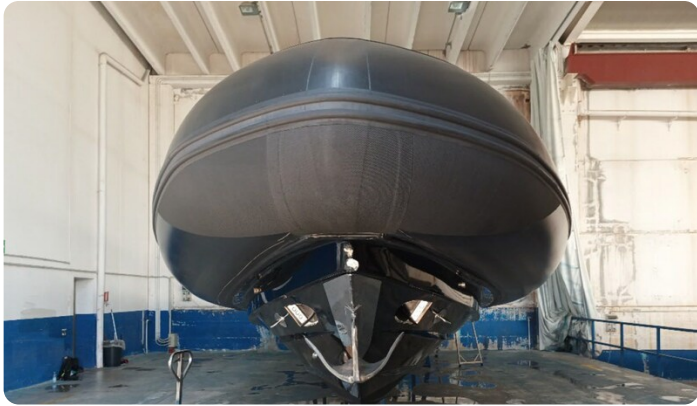
Dariel DTS Bow