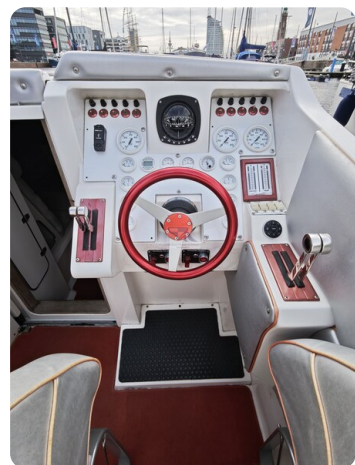
Cigarette 31 BULLET 11