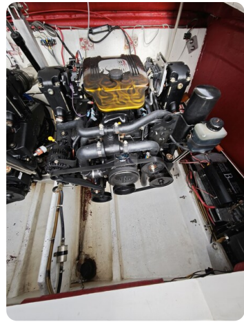
Cigarette 31 BULLET 36