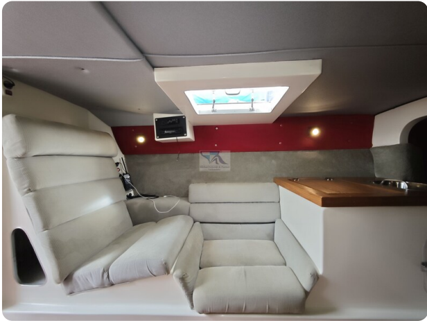
Cigarette 31 BULLET 18