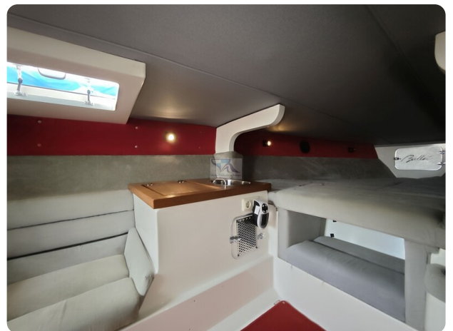
Cigarette 31 BULLET 19