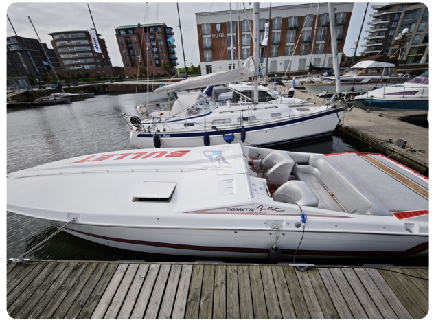
Cigarette 31 BULLET 46