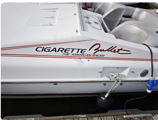
Cigarette 31 BULLET 10