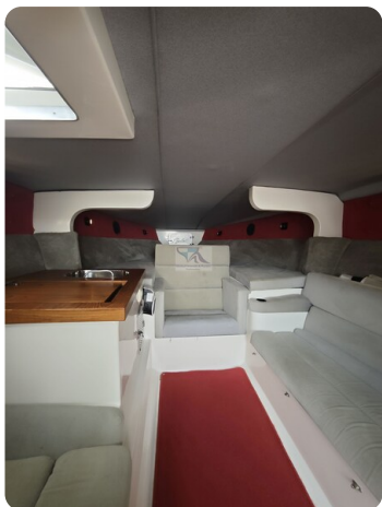
Cigarette 31 BULLET 25