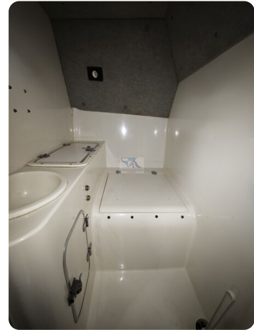
Cigarette 31 BULLET 27