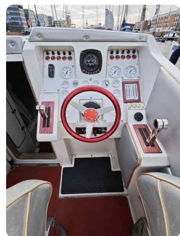
Cigarette 31 BULLET 11