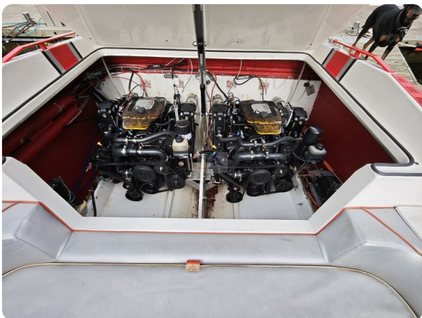
Cigarette 31 BULLET 32