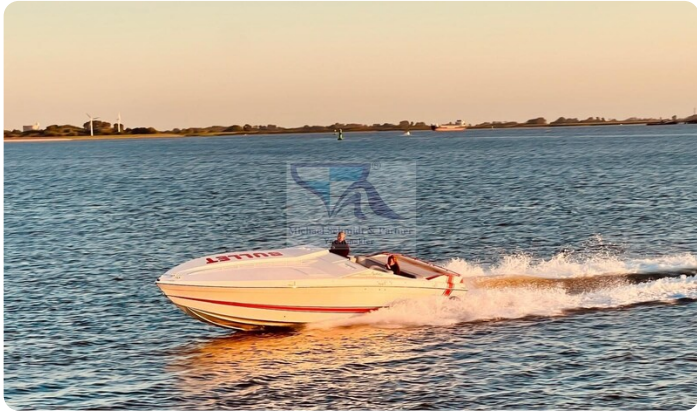
Cigarette 31 BULLET 2