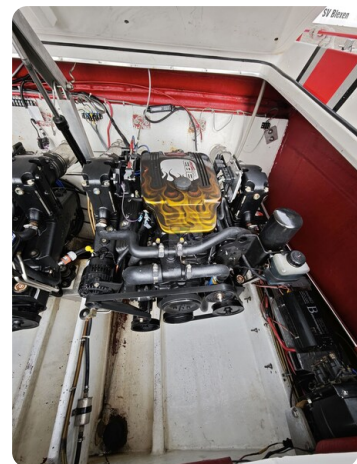
Cigarette 31 BULLET 33