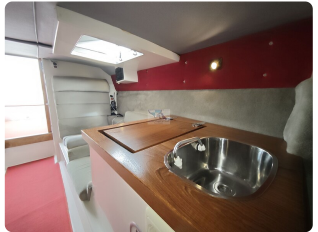
Cigarette 31 BULLET 24