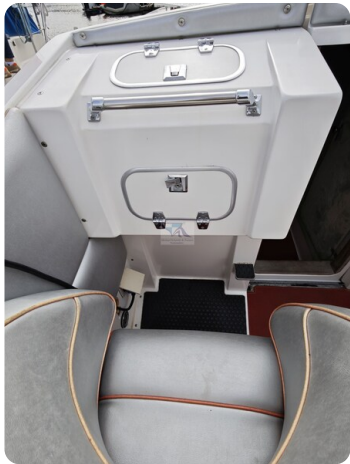
Cigarette 31 BULLET 14