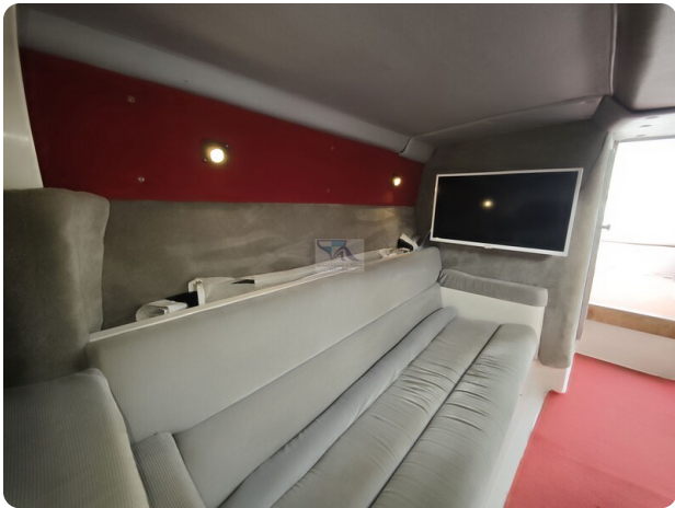
Cigarette 31 BULLET 22