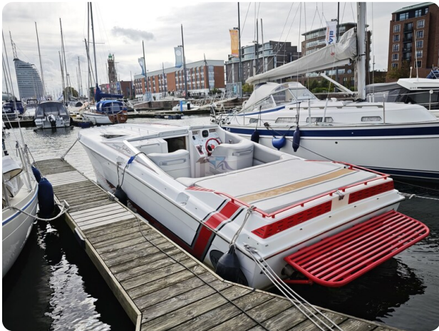
Cigarette 31 BULLET 47