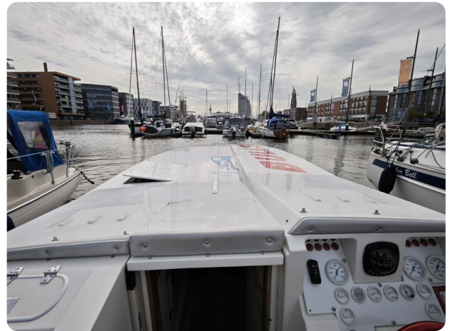
Cigarette 31 BULLET 16