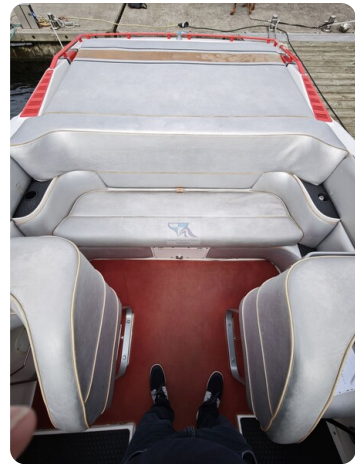
Cigarette 31 BULLET 30