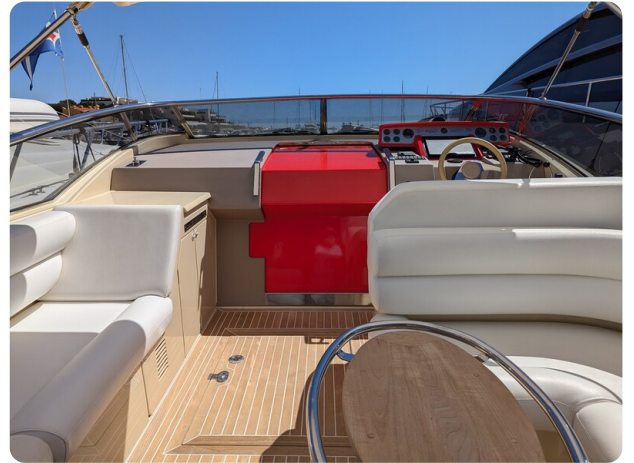
Sarnico Spider cockpit view too