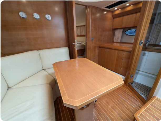
Sarnico Spider salon view