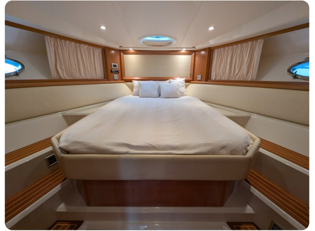
Sarnico Spider owner's cabin