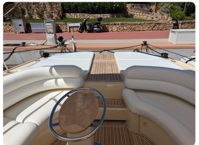
Sarnico Spider cockpit view