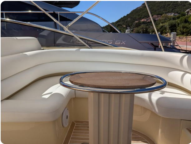
Sarnico Spider cockpit dinette