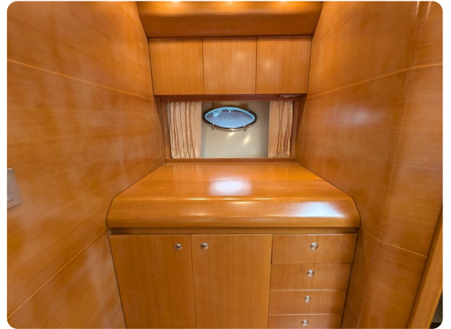
Sarnico Spider galley, closed