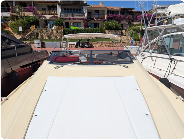
Sarnico Spider bow sunpad