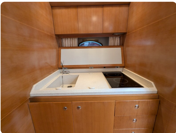
Sarnico Spider galley