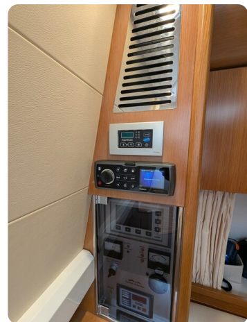
Sarnico Spider salon detail