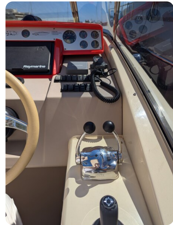
Sarnico Spider joystick