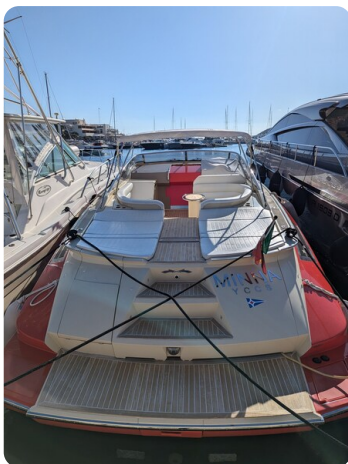
Sarnico Spider stern