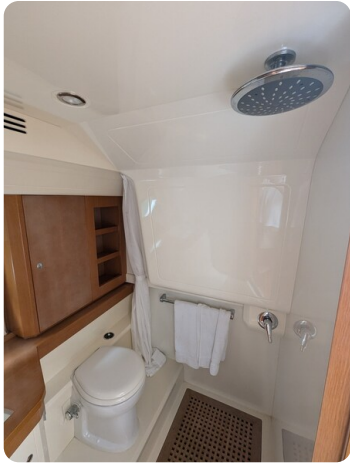
Sarnico Spider shower