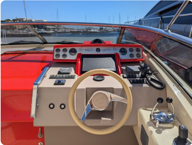
Sarnico Spider helm