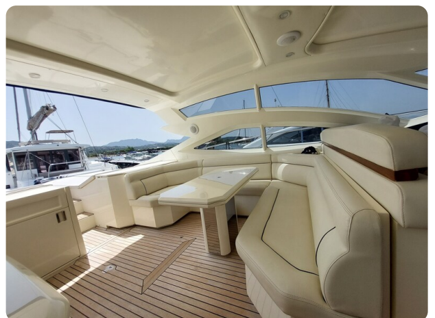
Sarnico 60 RiAl exterior dinette