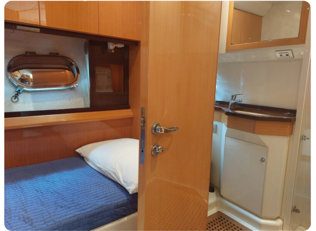
Sarnico 60 RiAl double cabin and wc