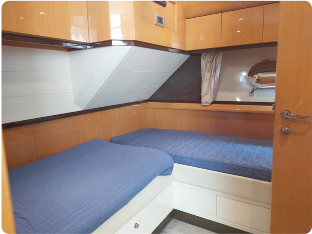
Sarnico 60 RiAl double cabin