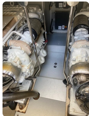
Sarnico 60 engine