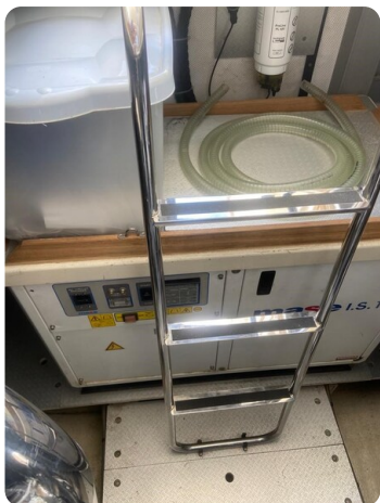
Sarnico 60, engine room