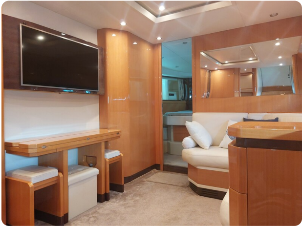
Sarnico 60 RiAl interior salon