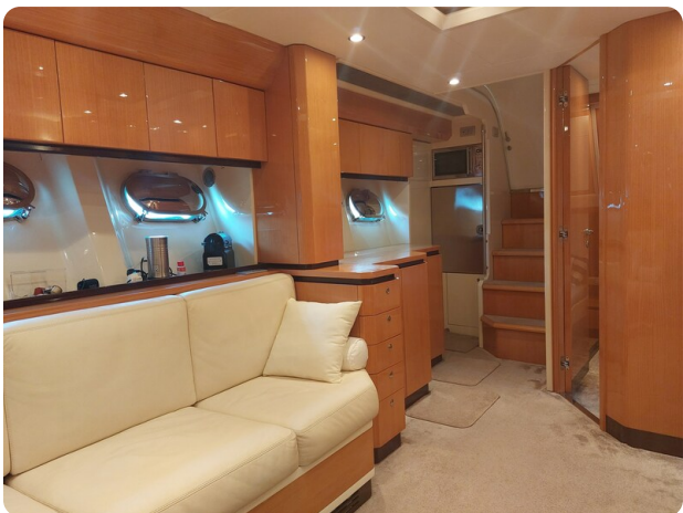
Sarnico 60 RiAl dinette and galley