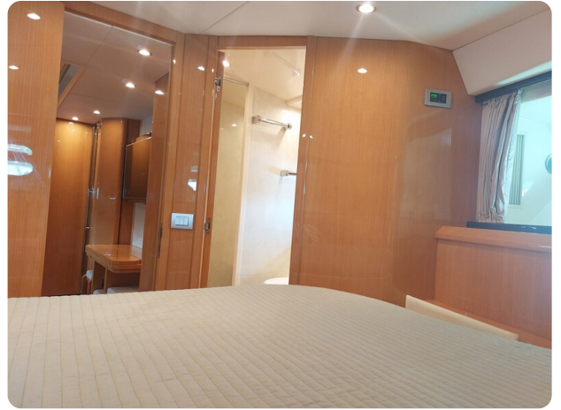
Sarnico 60 RiAl pics 141710