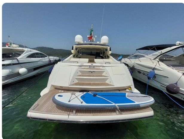
Sarnico 60 RiAl aft view