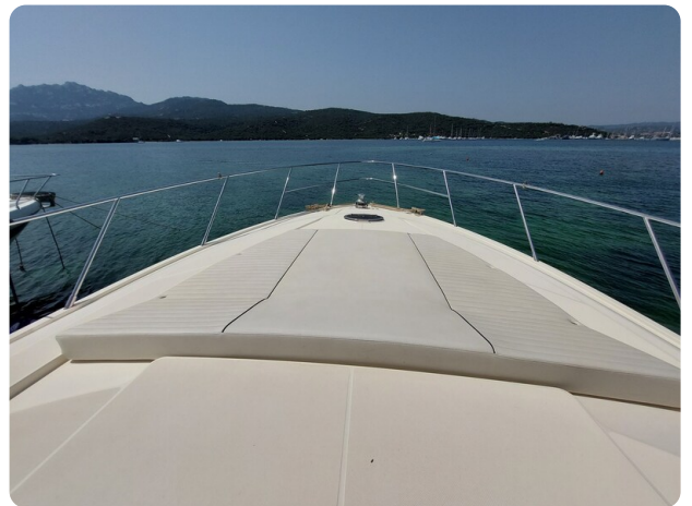
Sarnico 60 RiAl bow