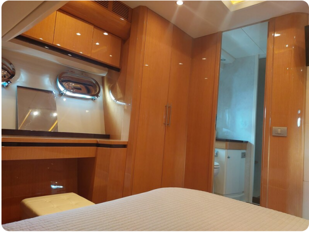
Sarnico 60 RiAl pics 141919