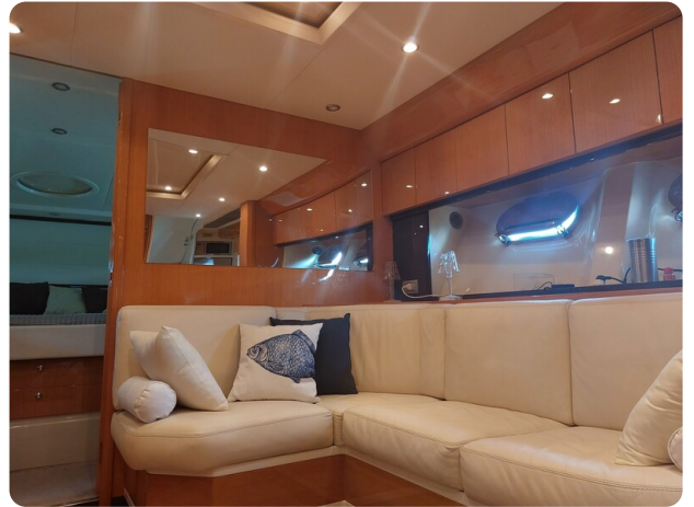
Sarnico 60 RiAl interior salon (1)