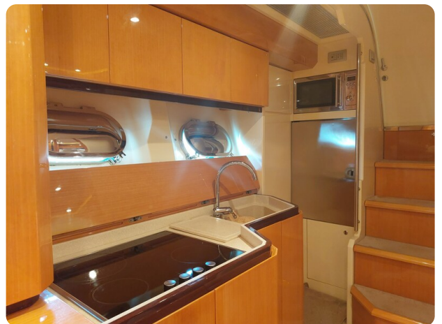
Sarnico 60 RiAl interior galley