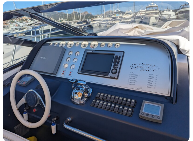
Sarnico 58 helm station