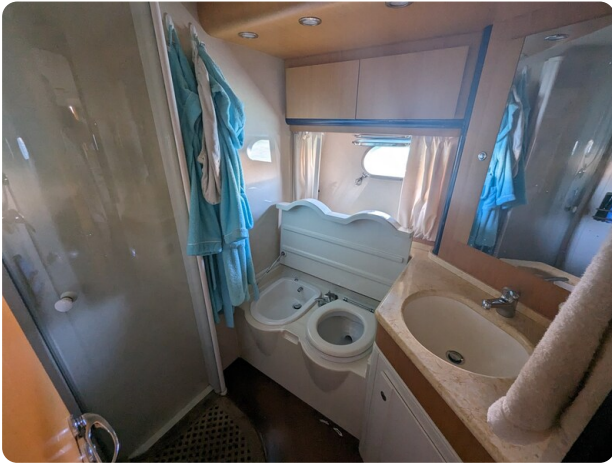
Sarnico 58 owner's bathroom