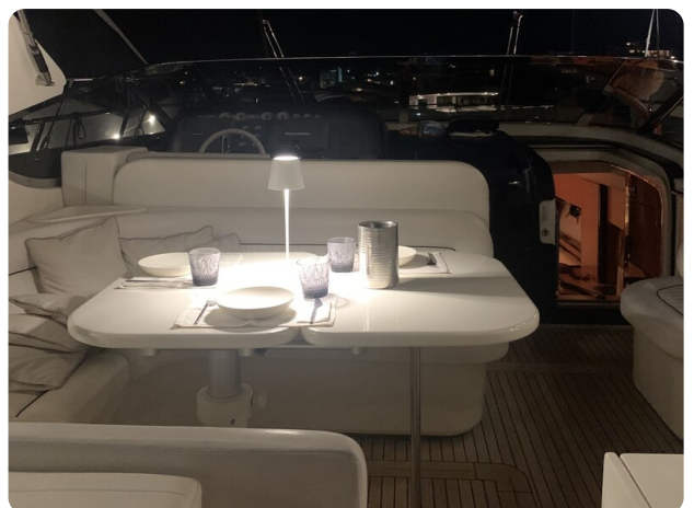
Sarnico 58 night view