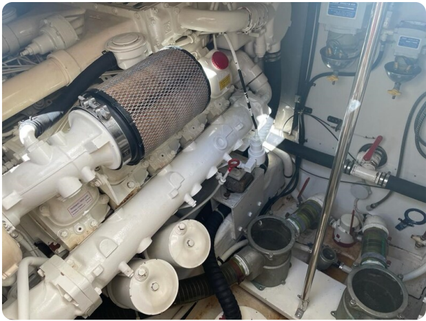
Sarnico 58 engine