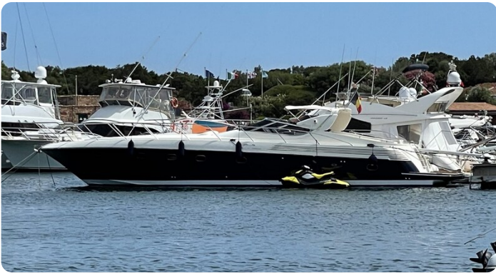
Sarnico 58 profile