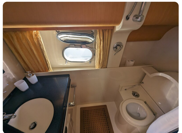
Sarnico 58 guest bathroom