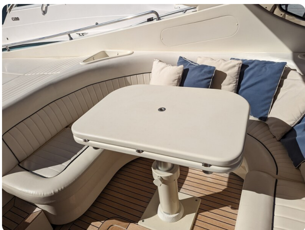
Sarnico 58 cockpit dinette