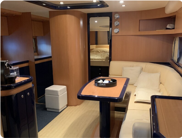
Sarnico 58 salon