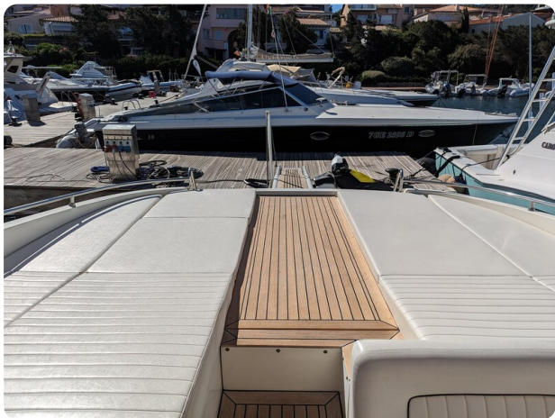
Sarnico 58 aft sunpad