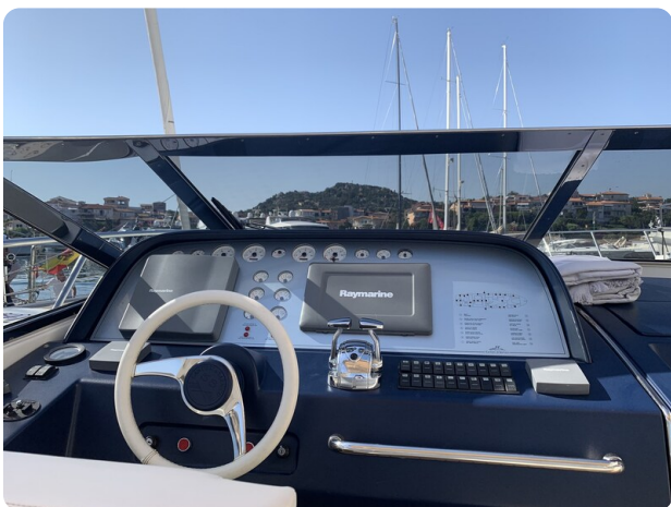
Sarnico 58 helm