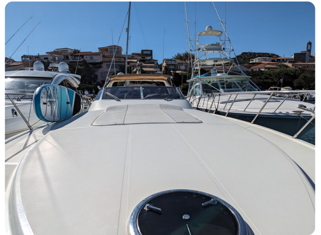
Sarnico 58 bow view