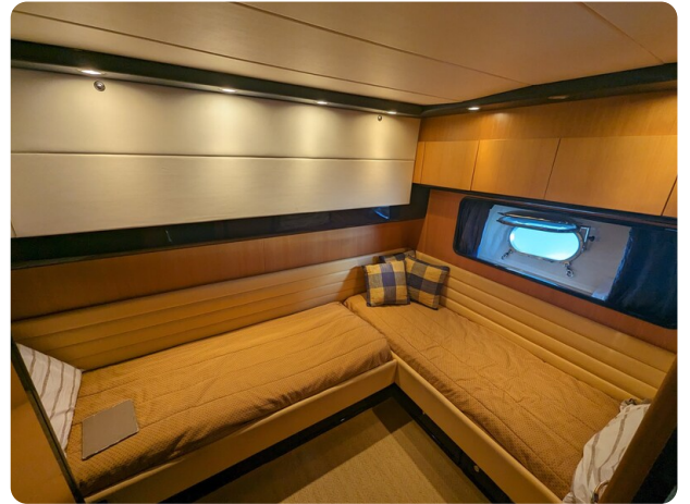
Sarnico 58 guest L cabin