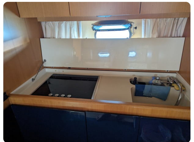
Sarnico 58 galley