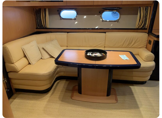
Sarnico 58 salon dinette