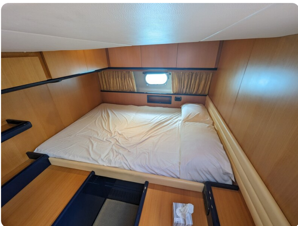
Sarnico 58 Vip cabin