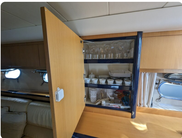
Sarnico 58 salon detail