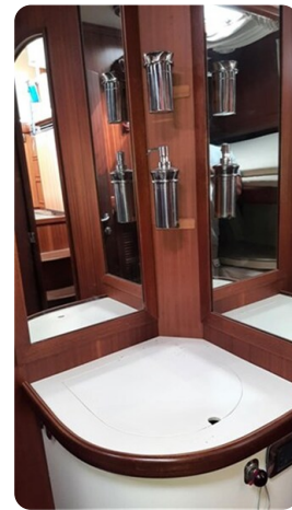
Guest cabin vanity