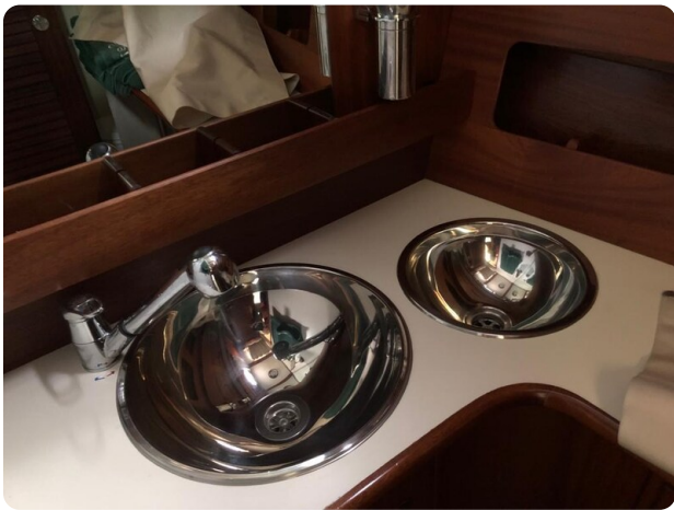
Guest cabin vanity 2