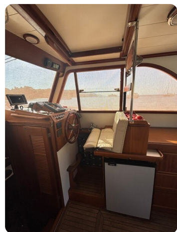
Helm station 1