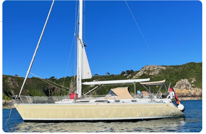
Grand Soleil 45 1