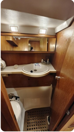
Grand Soleil 45 113