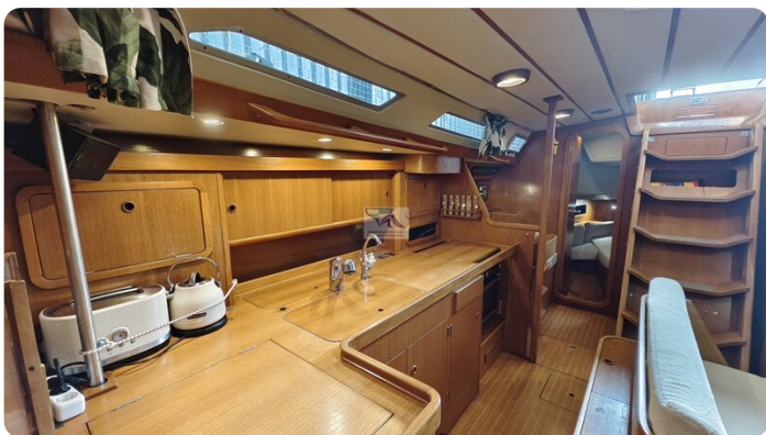
Grand Soleil 45 99