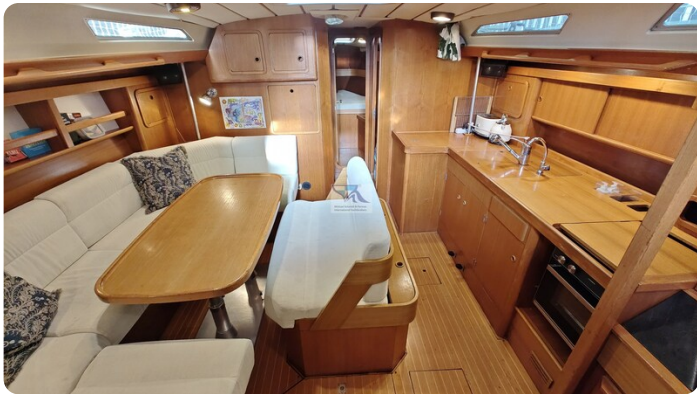
Grand Soleil 45 95