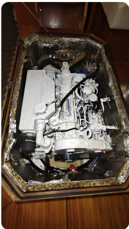
Grand Soleil 45 4