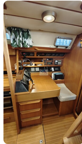
Grand Soleil 45 96