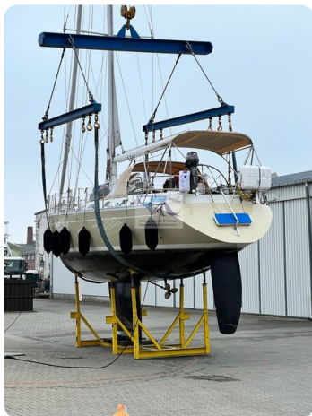
Grand Soleil 45 78