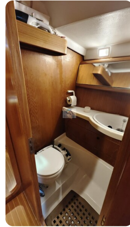
Grand Soleil 45 111