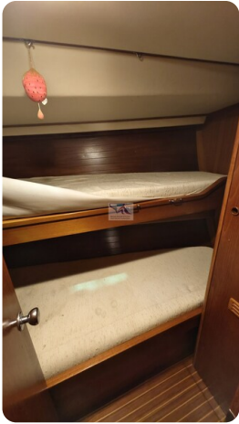
Grand Soleil 45 106