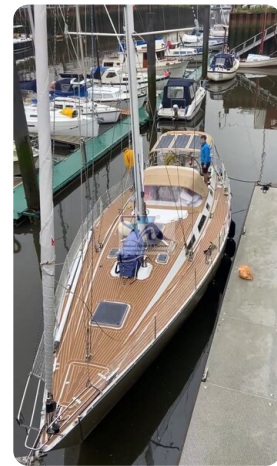
Grand Soleil 45 70