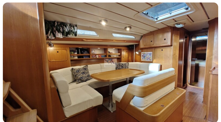
Grand Soleil 45 93