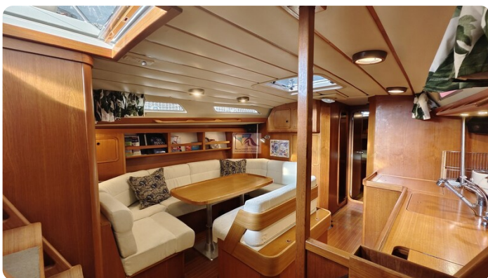
Grand Soleil 45 92