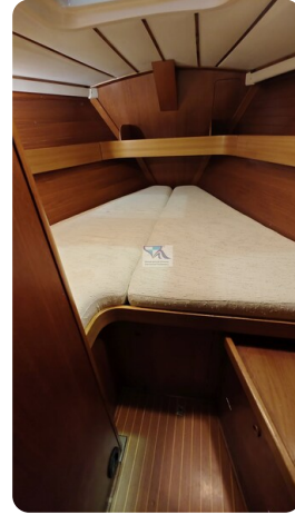
Grand Soleil 45 114