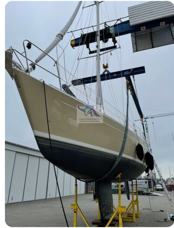
Grand Soleil 45 74