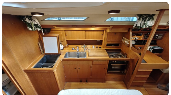
Grand Soleil 45 101