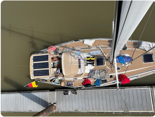
Grand Soleil 45 72