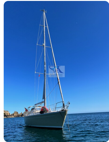
Grand Soleil 45 86