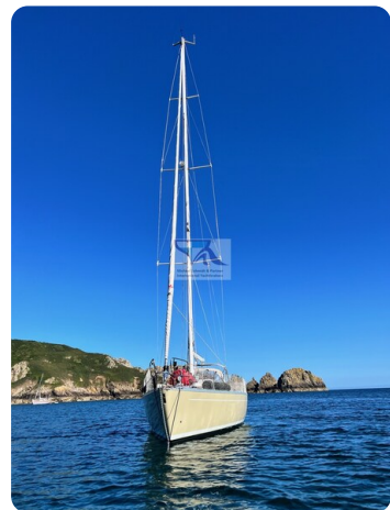
Grand Soleil 45 85