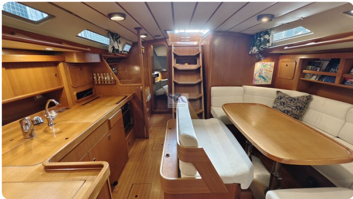
Grand Soleil 45 97