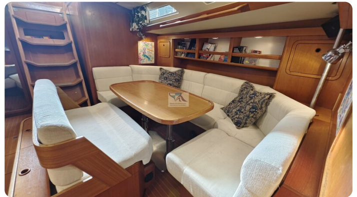
Grand Soleil 45 98