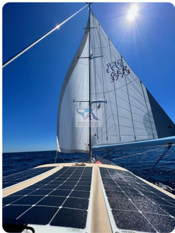
Grand Soleil 45 88