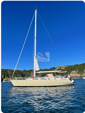
Grand Soleil 45 82