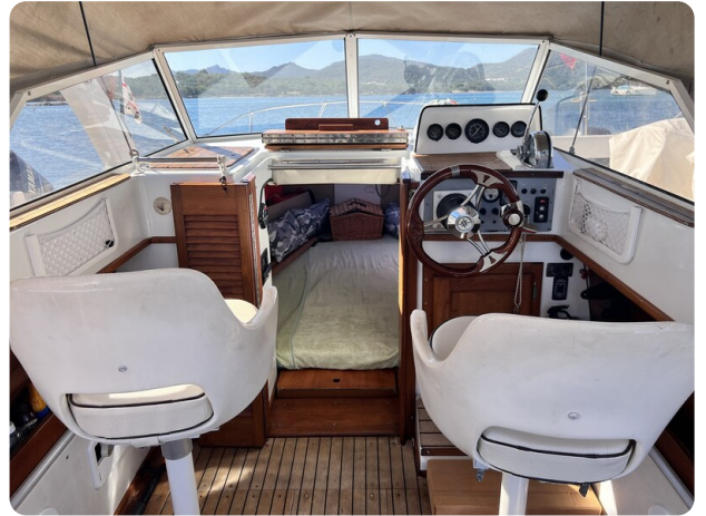
Boston Whaler 22 REVENGE