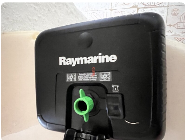
Boston Whaler 22 REVENGE Raymarine