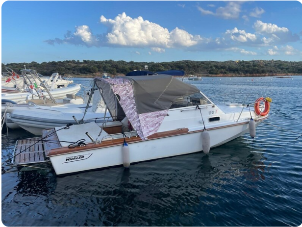
Boston Whaler 22 REVENGE