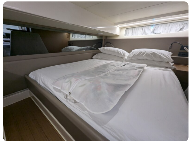
Bluegame 42 aft cabin