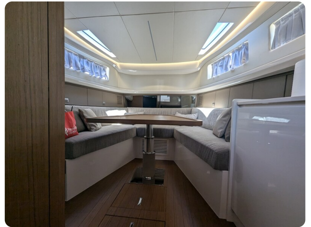
Bluegame 42 conv. dinette