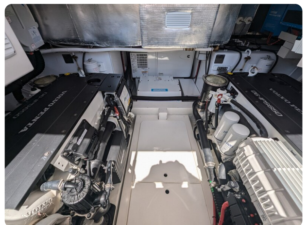
Bluegame 42 engine room