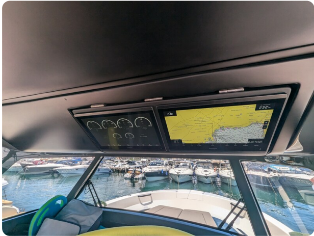
Bluegame 42 electronics