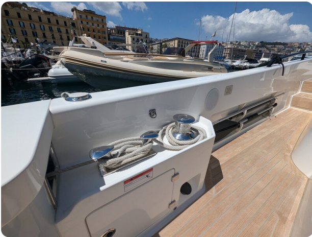
Bluegame 42 cockpit winches