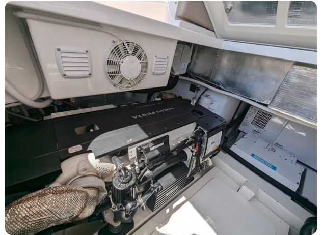
Bluegame 42 port engine