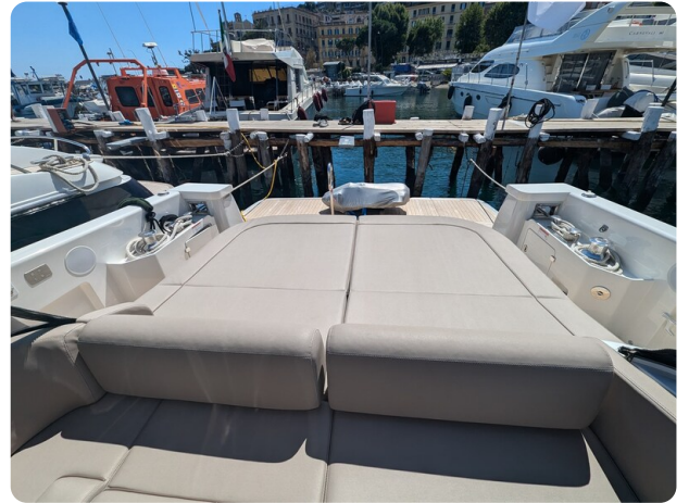
Bluegame 42 cockpit sunpad