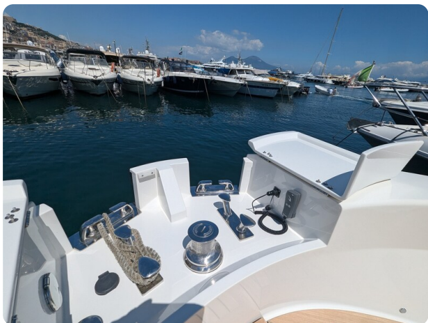
Bluegame 42 windlass detail