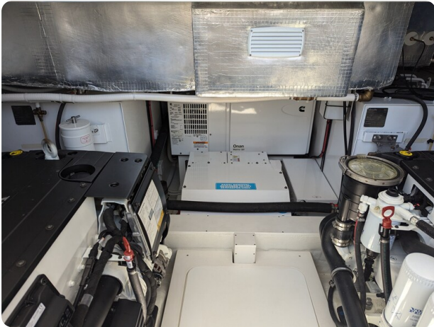
Bluegame 42 Onan generator