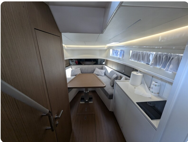
Bluegame 42 interiors