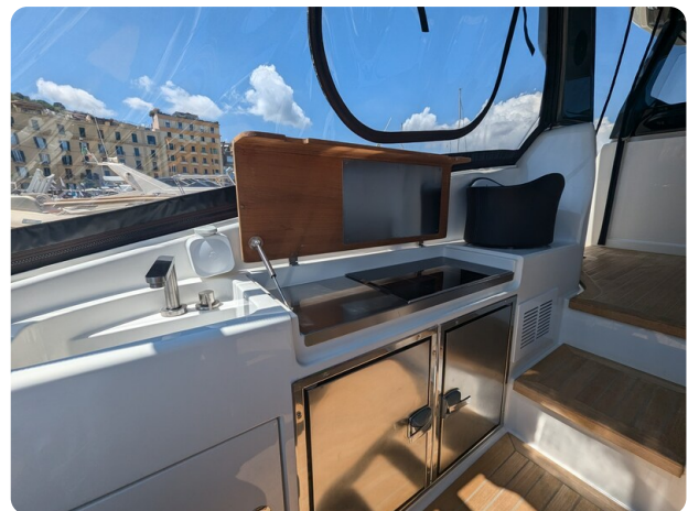
Bluegame 42 cockpit galley