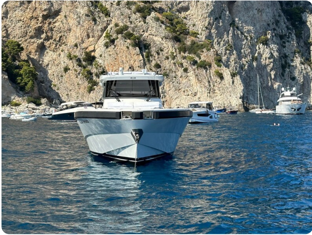
Bluegame 42 bow