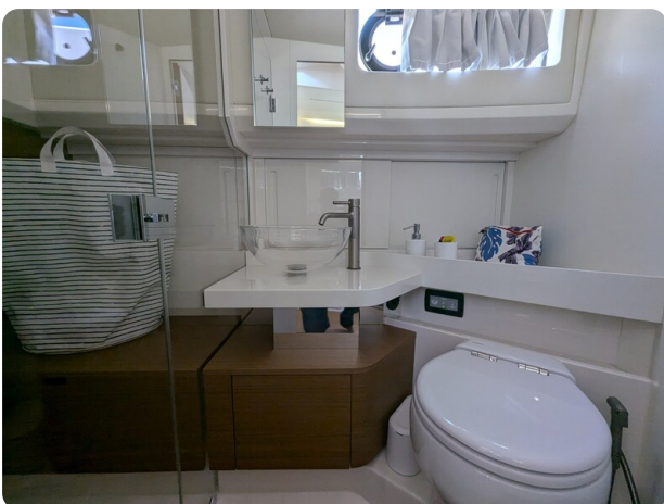
Bluegame 42 bathroom