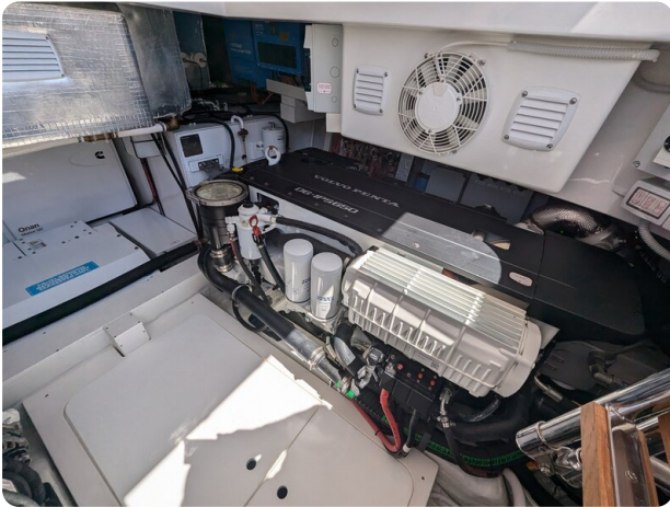
Bluegame 42 stbd engine