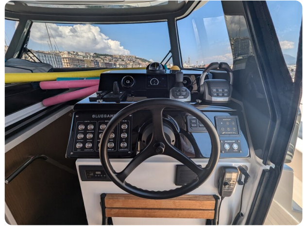
Bluegame 42 helm station