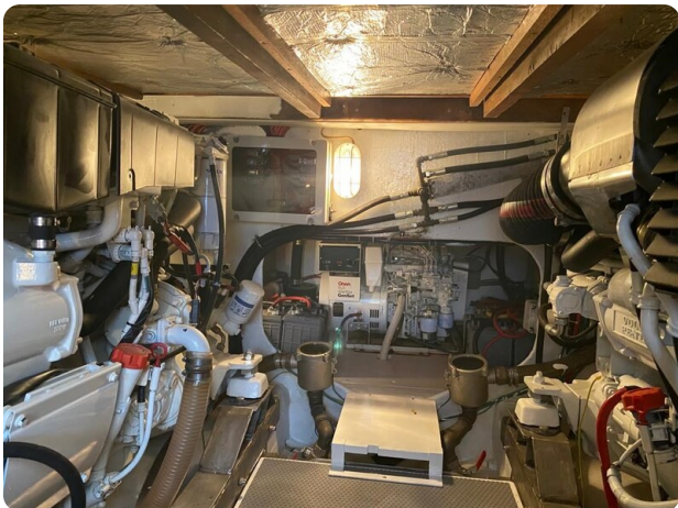
{1} engine room