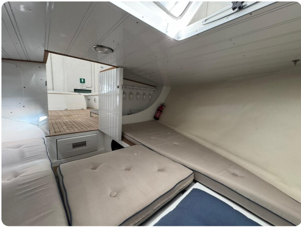
{1} Cabin detail