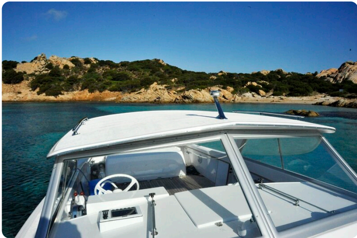
Bertram 25 MKII Hard Top windshield