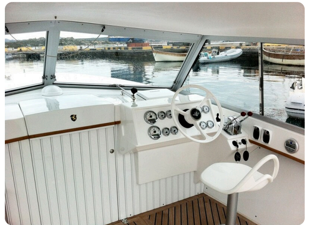
Bertram 25 MKII Hard Top helm