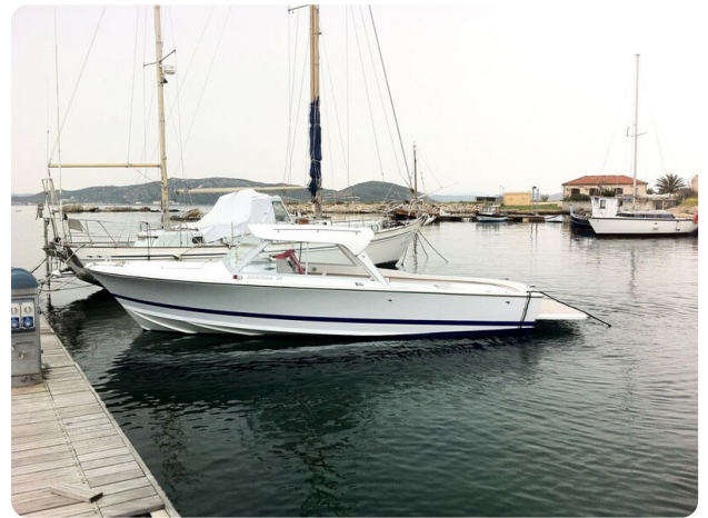
Bertram 25 MKII Hard Top