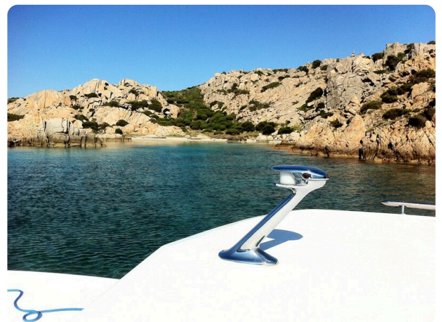
Bertram 25 MKII Hard Top detail