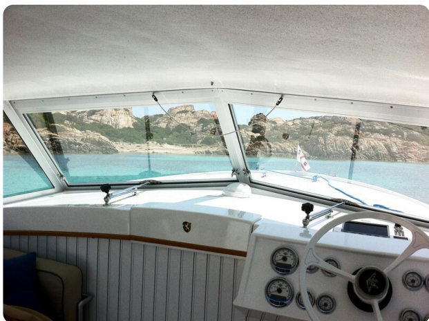
Bertram 25 MKII Hard Top detail 5