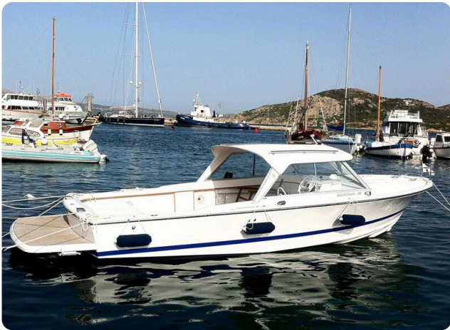
Bertram 25 MKII Hard Top profile