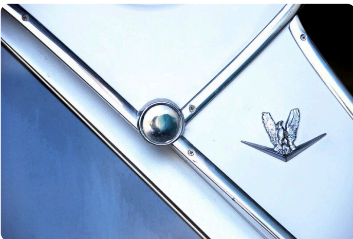
Bertram 25 MKII Hard Top detail 2