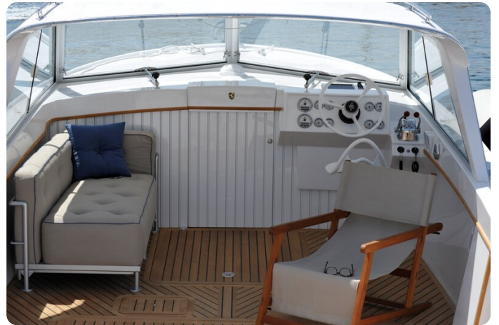
Bertram 25 MKII Hard Top cockpit dinette