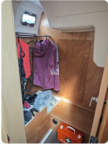
Oceanis 35.1 35