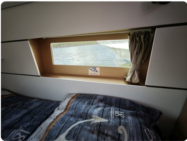
Oceanis 35.1 27