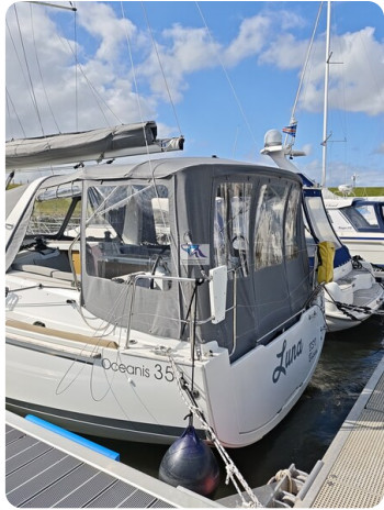
Oceanis 35.1 5