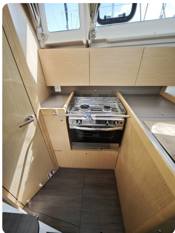
Oceanis 35.1 20