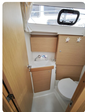
Oceanis 35.1 32