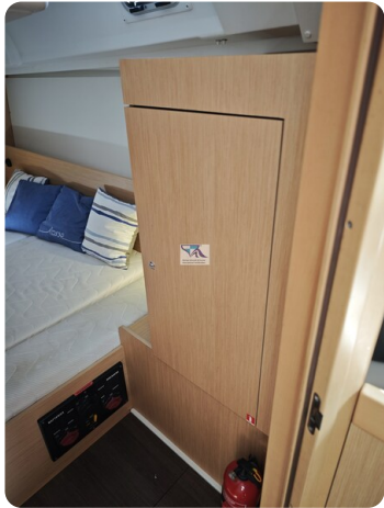
Oceanis 35.1 38