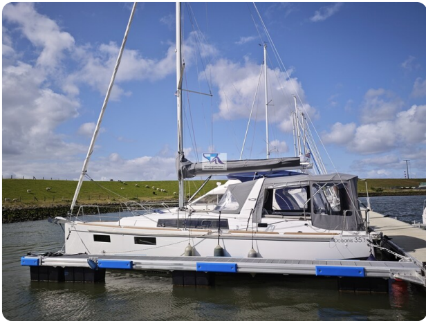
Oceanis 35.1 1