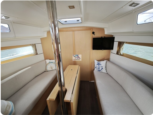
Oceanis 35.1 15