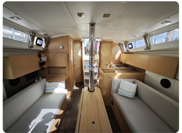
Oceanis 35.1 28