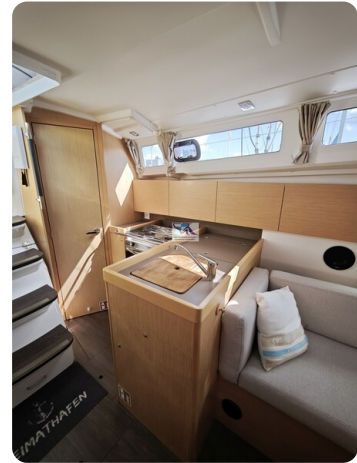
Oceanis 35.1 18