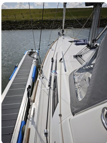
Oceanis 35.1 51