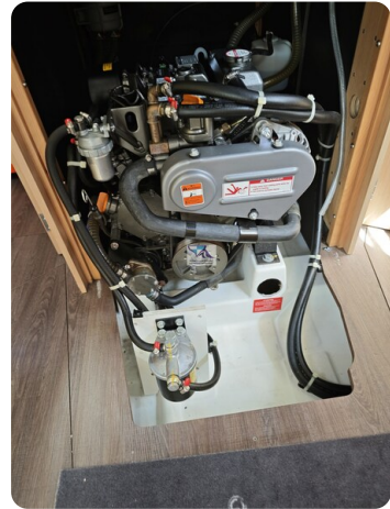
Oceanis 35.1 43