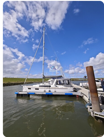
Oceanis 35.1 2