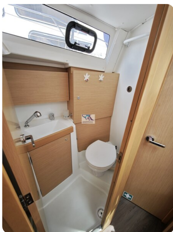
Oceanis 35.1 31