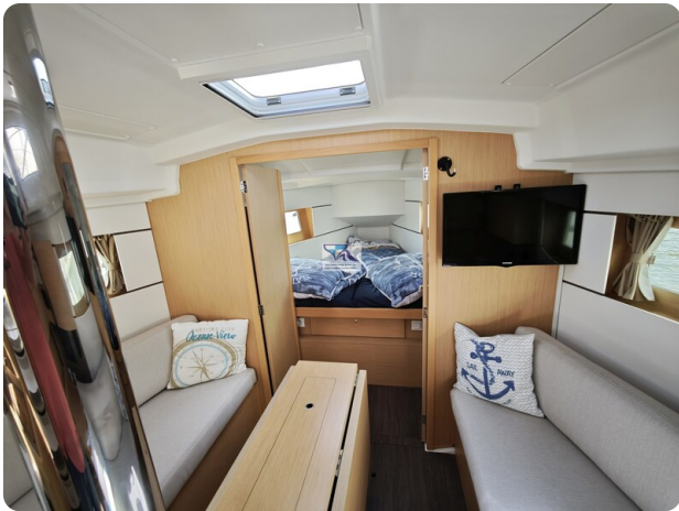
Oceanis 35.1 22