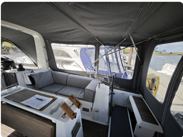
Oceanis 35.1 71