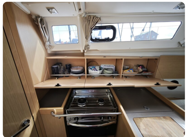
Oceanis 35.1 21