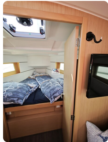
Oceanis 35.1 24