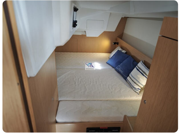
Oceanis 35.1 37