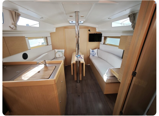
Oceanis 35.1 10