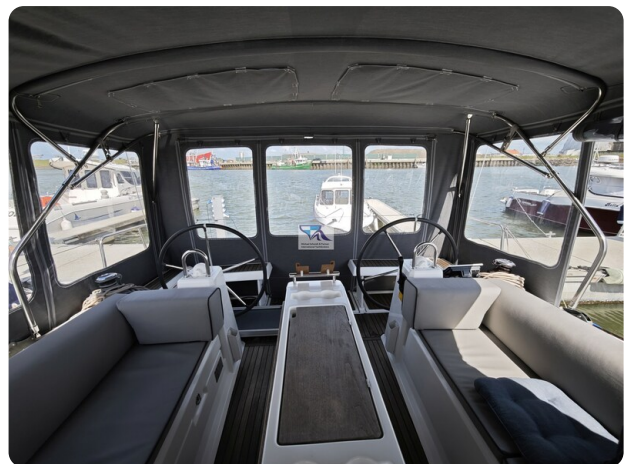
Oceanis 35.1 76