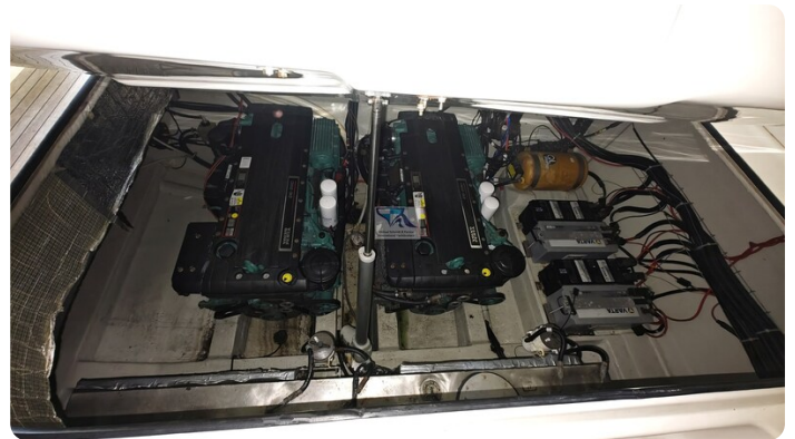
Bavaria 37 Sport msp793423 35