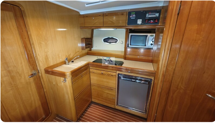
Bavaria 37 Sport msp793423 63