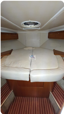
Bavaria 37 Sport msp793423 76