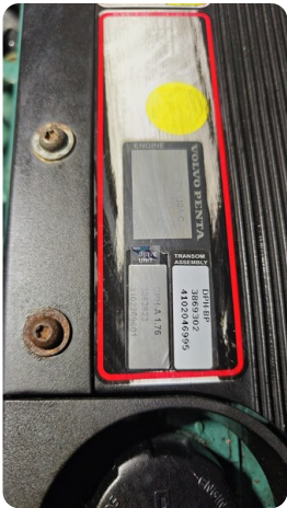
Bavaria 37 Sport msp793423 33