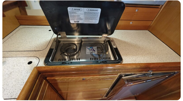
Bavaria 37 Sport msp793423 68