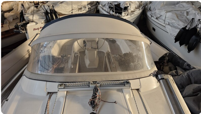
Bavaria 37 msp749314 8