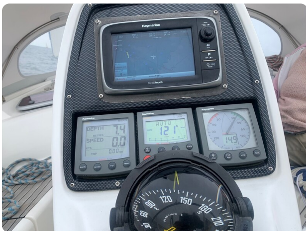
Bavaria 37 msp749314 10