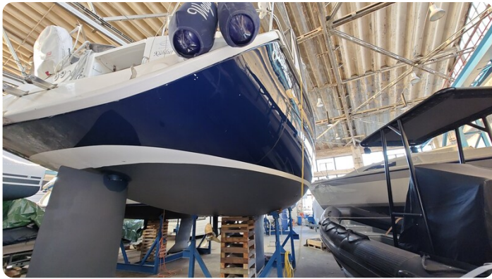
Bavaria 37 msp749314 6