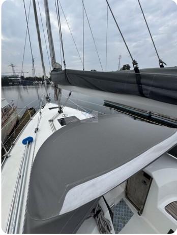
Bavaria 32 Cruiser HERON 61