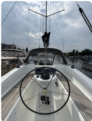
Bavaria 32 Cruiser HERON 58