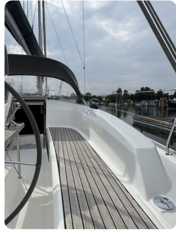
Bavaria 32 Cruiser HERON 57