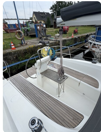
Bavaria 32 Cruiser HERON 45