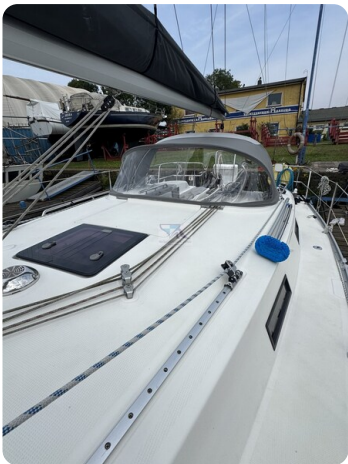
Bavaria 32 Cruiser HERON 63