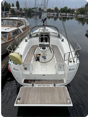
Bavaria 32 Cruiser HERON 11