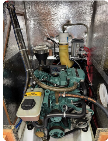
Bavaria 32 Cruiser HERON 19