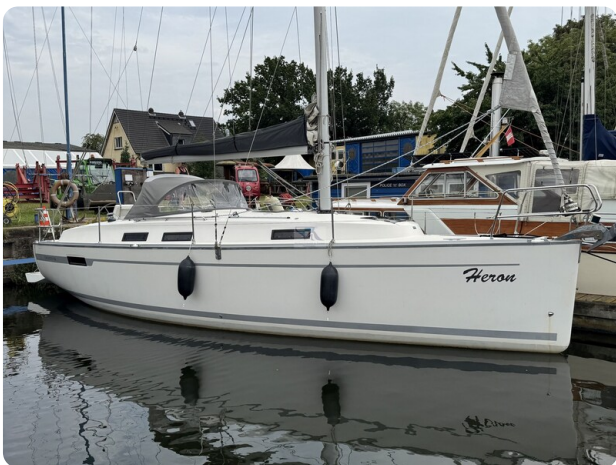
Bavaria 32 Cruiser HERON 6