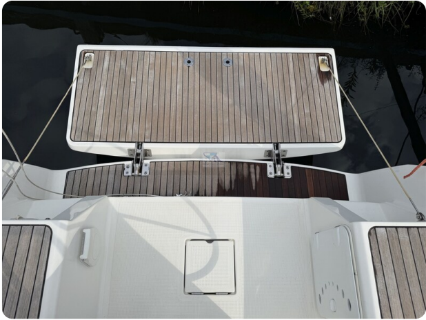
Bavaria 32 Cruiser HERON 59