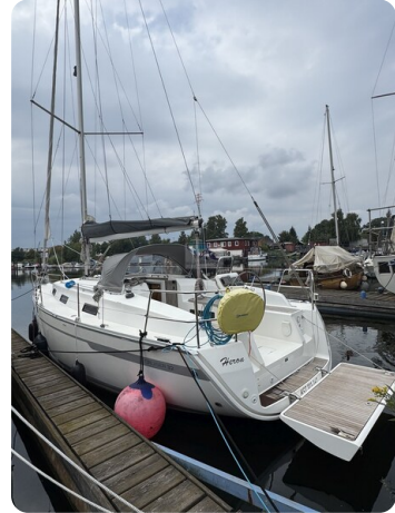
Bavaria 32 Cruiser HERON 2