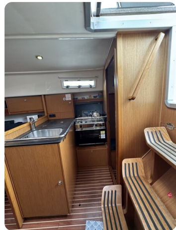
Bavaria 32 Cruiser HERON 40