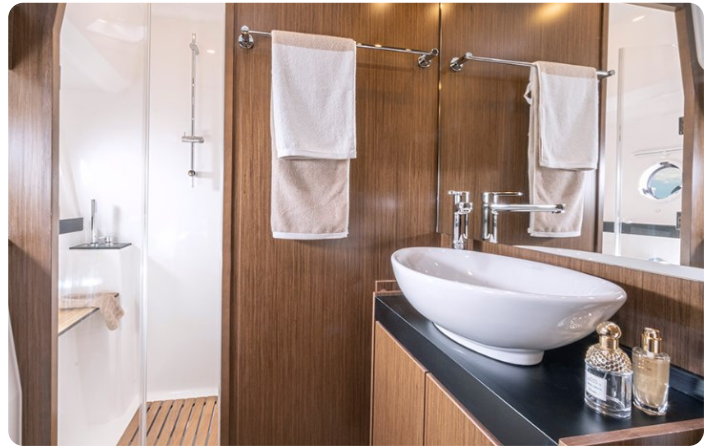
Bavaria 420 coupè wc