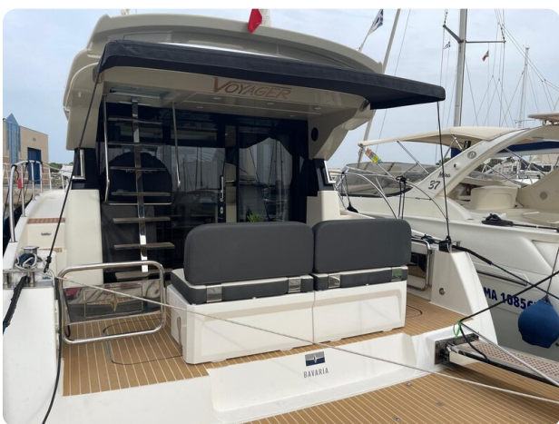
Bavaria 420 coupè