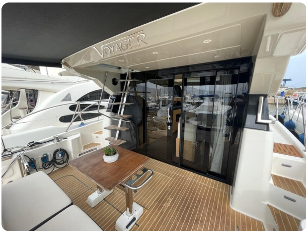
Bavaria 420 coupè