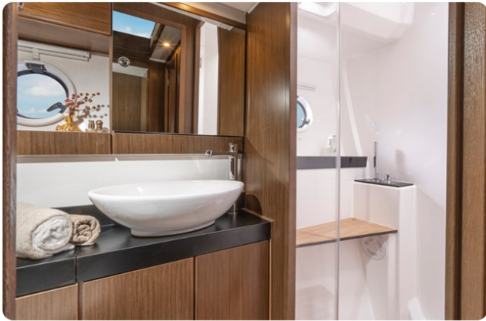
Bavaria Bavaria 420 coupè 420 coupè wc 1