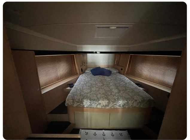
Bavaria 420 coupè