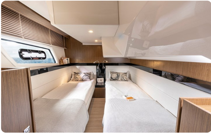
Bavaria 420 coupè double cabin