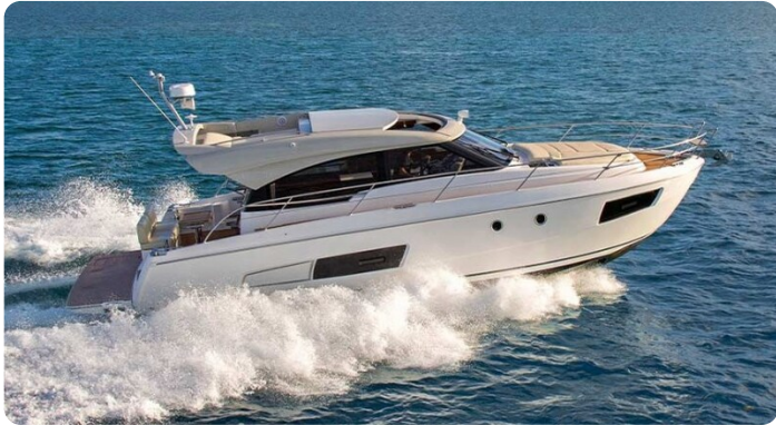
Bavaria 420 coupè Sistership