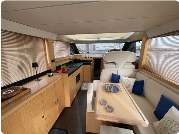
Bavaria 420 coupè