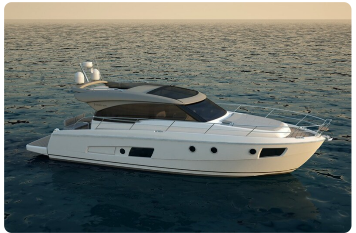
Bavaria 420 coupè sistership