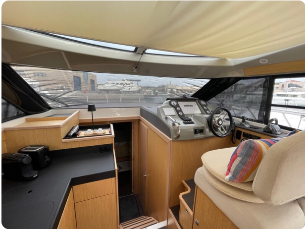
Bavaria 420 coupè