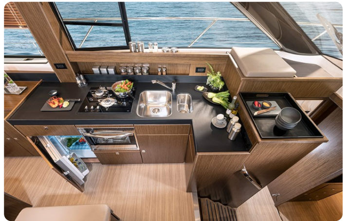
Bavaria 420 coupè galley