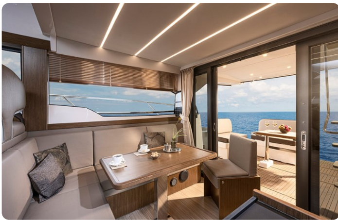
Bavaria 420 coupè dinette