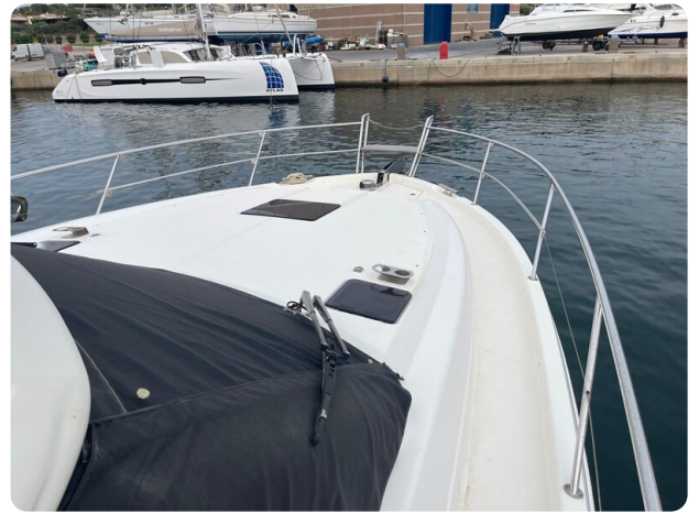
Bavaria 420 coupè