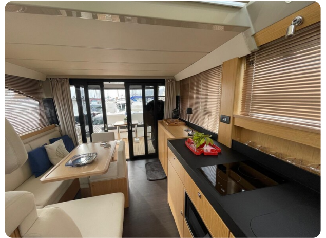
Bavaria 420 coupè