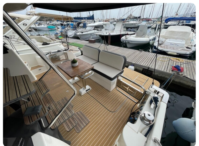
Bavaria 420 coupè