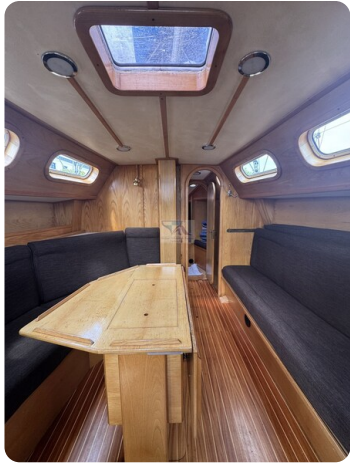
Baron 38 DER LETZTE BARON 72