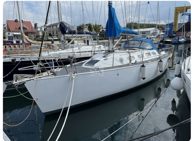
Baron 38 DER LETZTE BARON 25