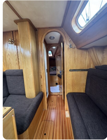
Baron 38 DER LETZTE BARON 58