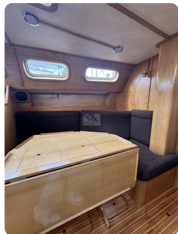
Baron 38 DER LETZTE BARON 59