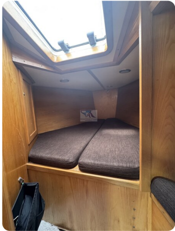
Baron 38 DER LETZTE BARON 55