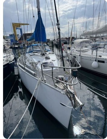
Baron 38 DER LETZTE BARON 22