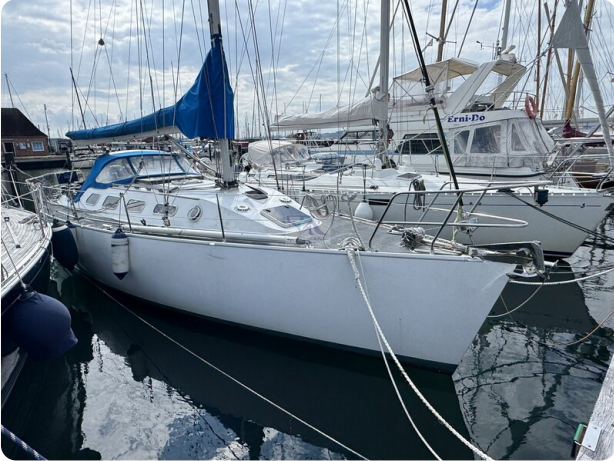
Baron 38 DER LETZTE BARON 20