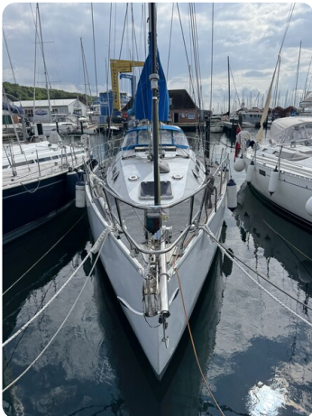
Baron 38 DER LETZTE BARON 23