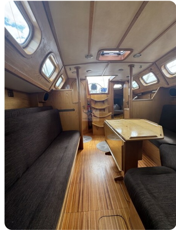
Baron 38 DER LETZTE BARON 53