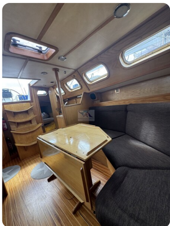
Baron 38 DER LETZTE BARON 52