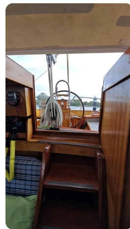
Baltika Decksalon SY 32