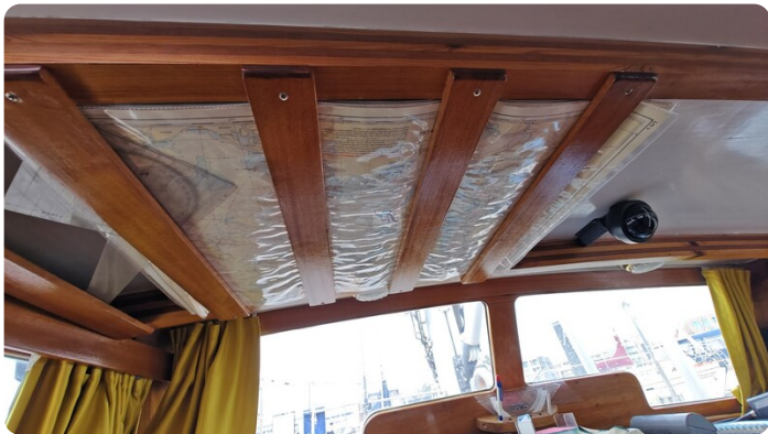
Baltika Decksalon SY 29