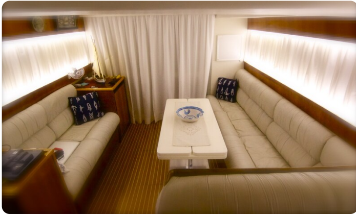
{1} Salon view