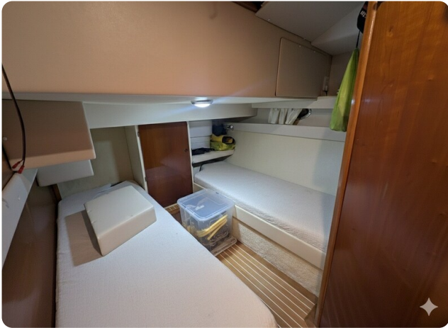
{1} Guest cabin