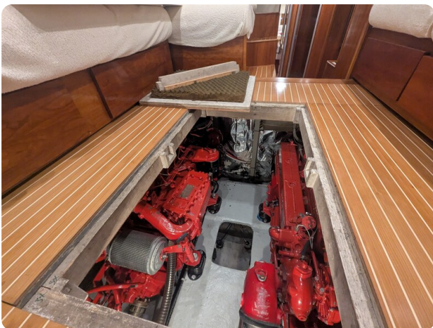
{1} Engine room