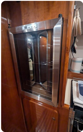
{1} Galley detail