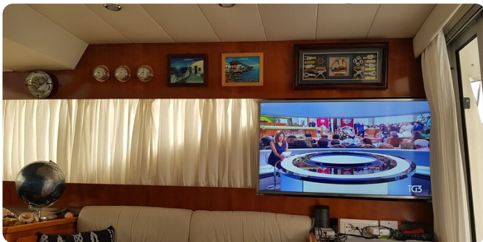
{1} Salon detail