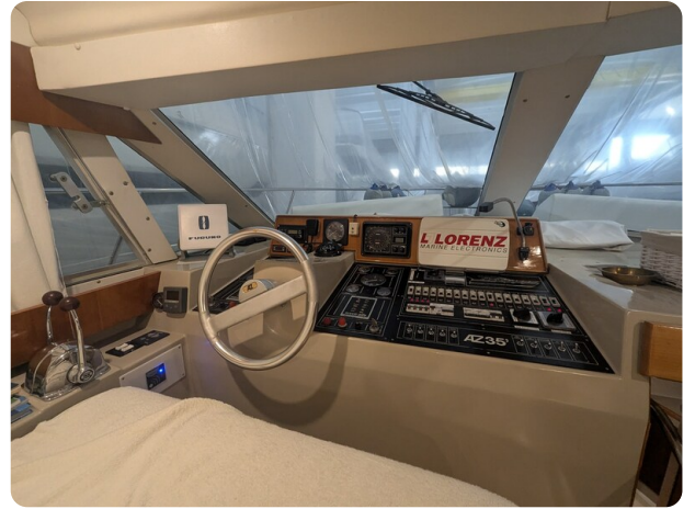
{1} Lower helm