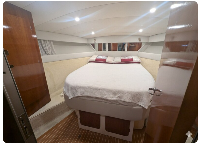
{1} Owner's cabin