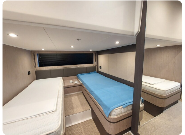
Azimut Atlantis 45 guest cabin