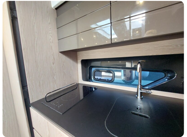
Azimut Atlantis 45 galley