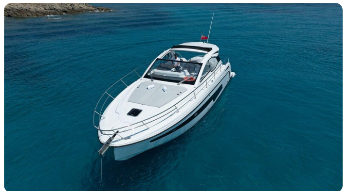
A45 Exterior View