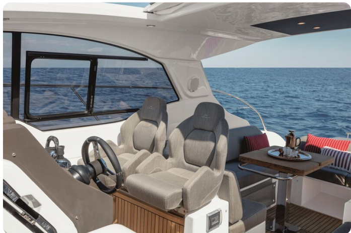
A45 Helmstation Seats