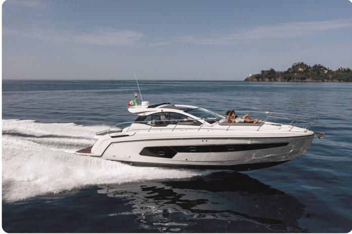
A45 Running 4