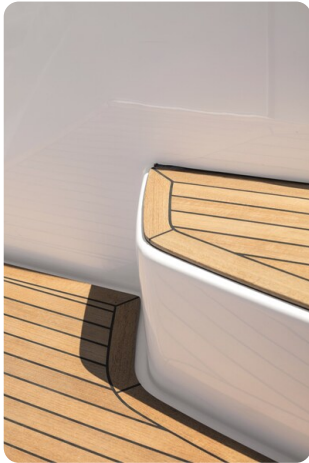
A45 Exterior Detail 2