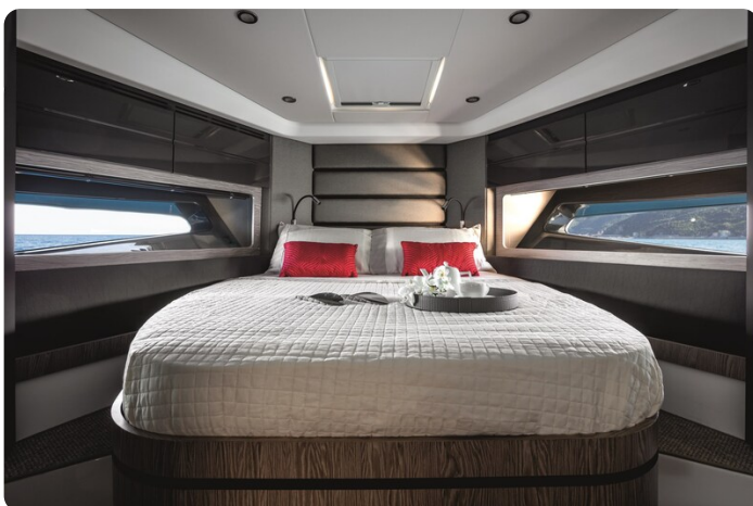
A45 Master Cabin