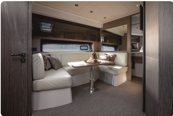
A45 Dinette 2