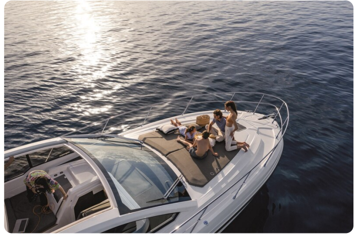
A45 Exterior View 2