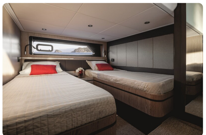
A45 Guest Cabin Twin beds