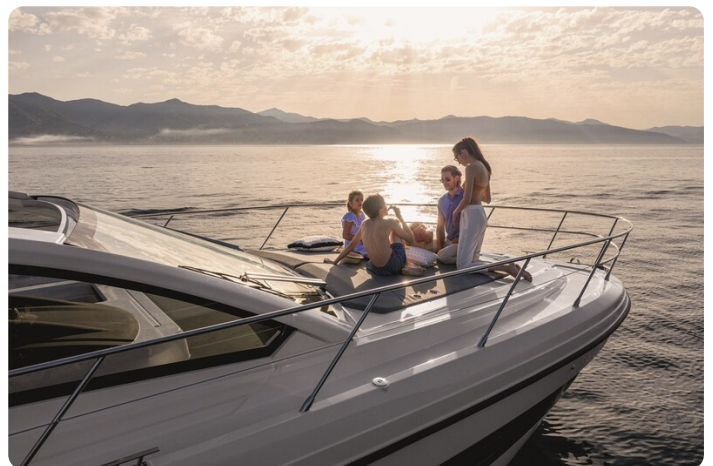
A45 Exterior View 3