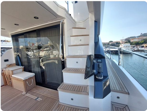
Azimut 53 Fly cockpit detail