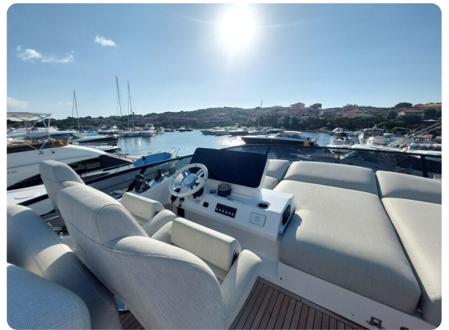
Azimut 53 Fly helm station