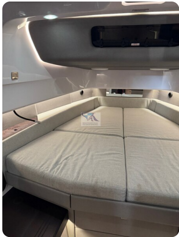
Axopar 45 32