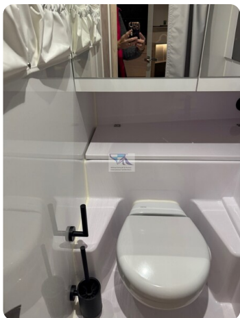
Axopar 45 30