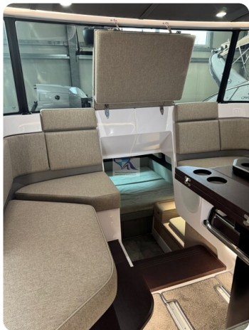
Axopar 45 39