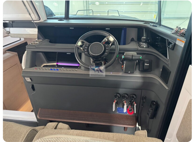
Axopar 45 27