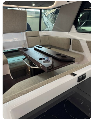
Axopar 45 38