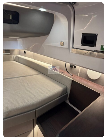
Axopar 45 31