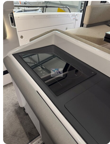
Axopar 45 36