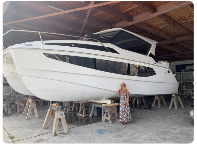
Aquila 36 Sport drydock