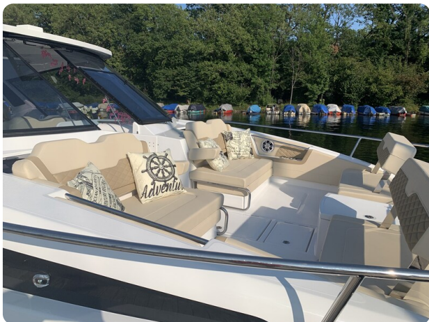
Aquila 36 Sport bow dinette