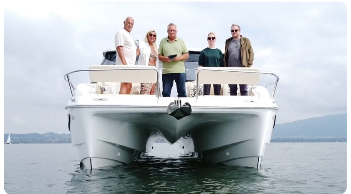
Aquila 36 Sport bow view