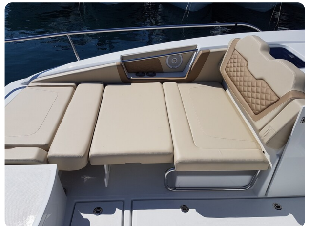
Aquila 36 Sport sunpad