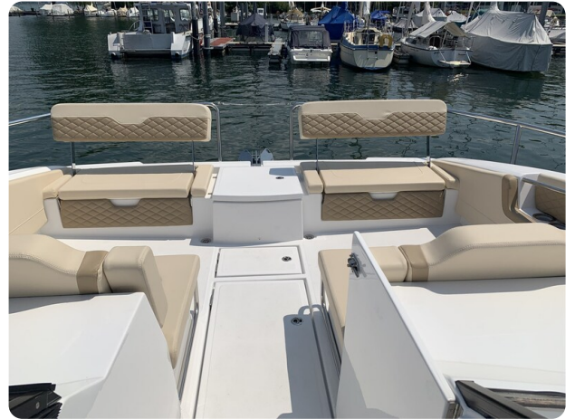
Aquila 36 Sport aft cockpit