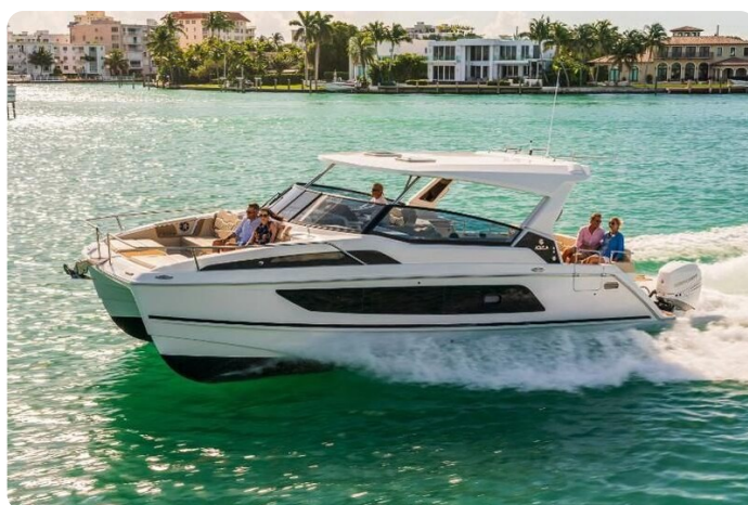
Aquila 36 Sport sistership