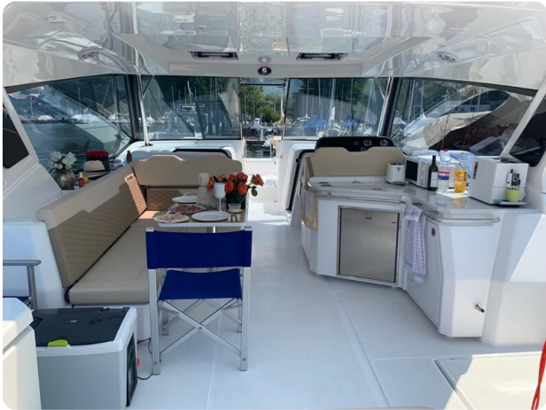
Aquila 36 Sport cockpit