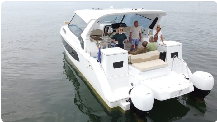
Aquila 36 Sport aft view