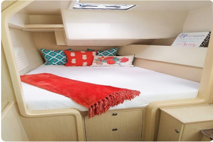
Aquila 36 Sport sistership cabin