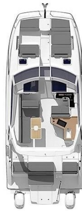
_Aquila 36 Sport Layout