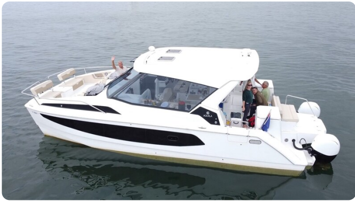
Aquila 36 Sport aerial