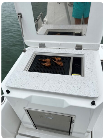
Aquila 36 Sport cockpit grill