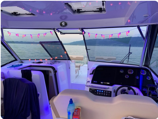
Aquila 36 Sport helm station