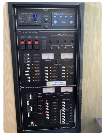
Aquila 36 Sport electrical panel