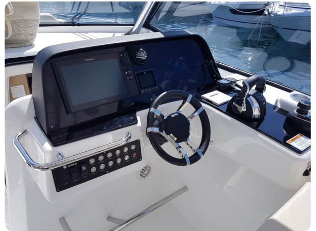
Aquila 36 Sport helm