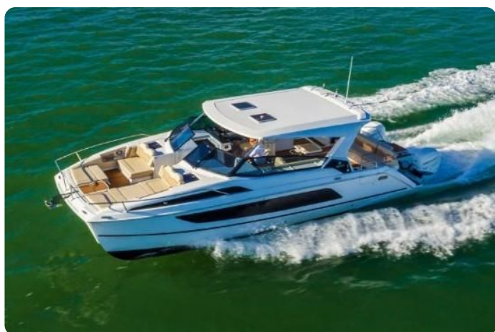
Aquila 36 Sport sistership