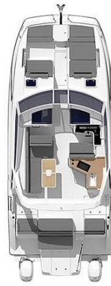
_Aquila 36 Sport Layout