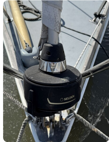
S & S 30 IVALU 2