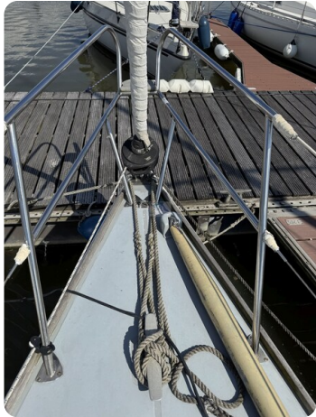
S & S 30 IVALU 40