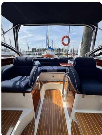
Aquador 23 DC SUND 43