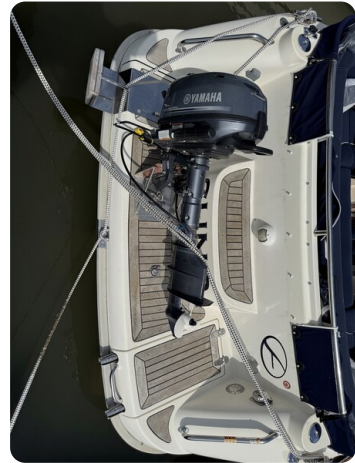
Aquador 23 DC SUND 5