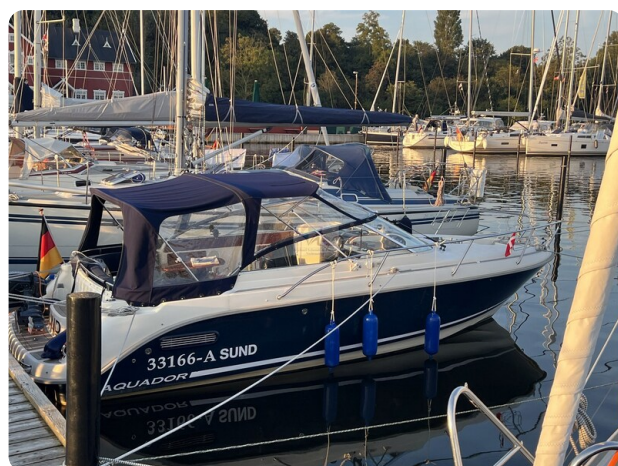
Aquador 23 7