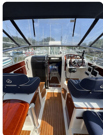
Aquador 23 DC SUND 42