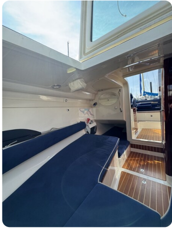
Aquador 23 DC SUND 9