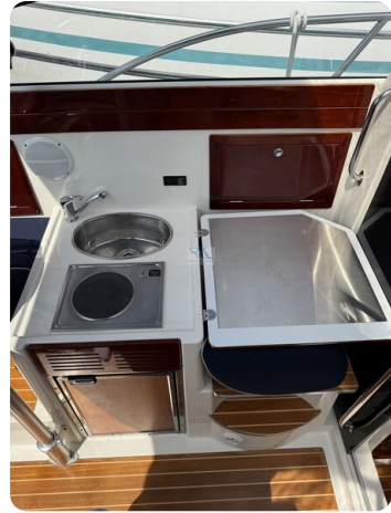
Aquador 23 DC SUND 19