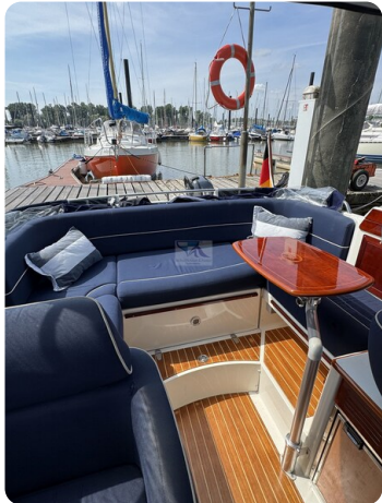
Aquador 23 DC SUND 25