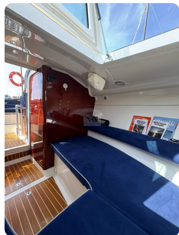
Aquador 23 DC SUND 8