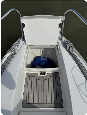
Aquador 23 DC SUND 27