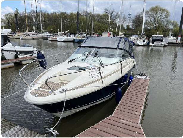
Aquador 23 14