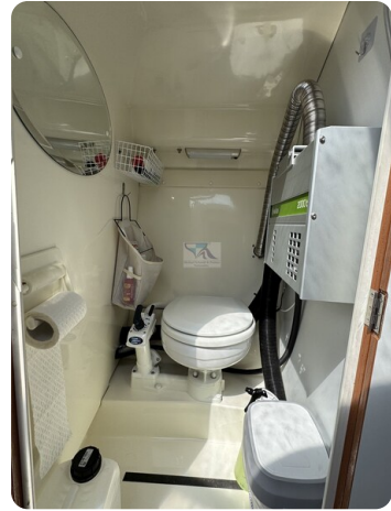
Aquador 23 DC SUND 17