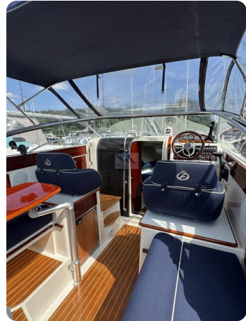
Aquador 23 DC SUND 22