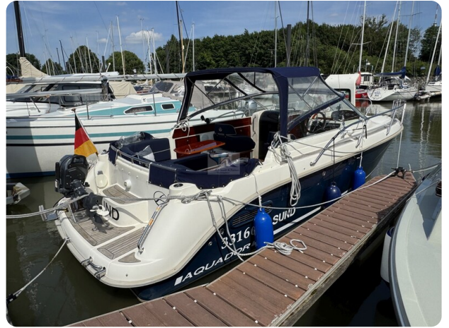
Aquador 23 DC SUND 31