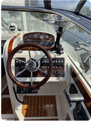
Aquador 23 DC SUND 41