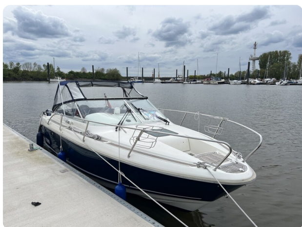
Aquador 23 4