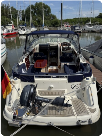
Aquador 23 DC SUND 33