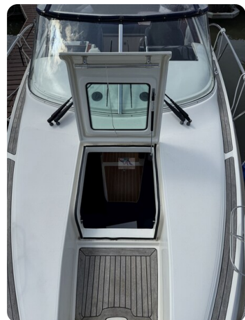
Aquador 23 DC SUND 29