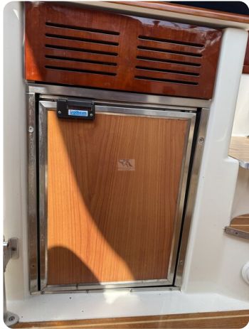
Aquador 23 DC SUND 21