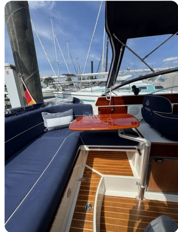
Aquador 23 DC SUND 24