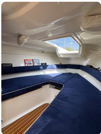
Aquador 23 DC SUND 11