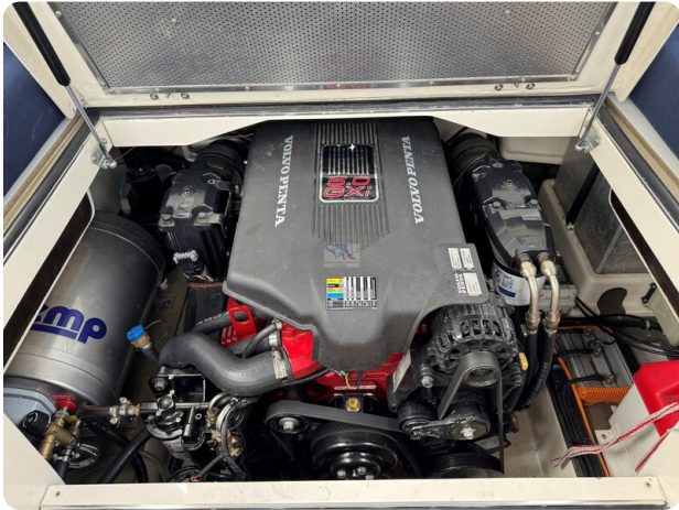
Aquador 23 DC SUND 46