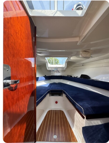
Aquador 23 DC SUND 14