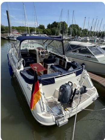
Aquador 23 DC SUND 32