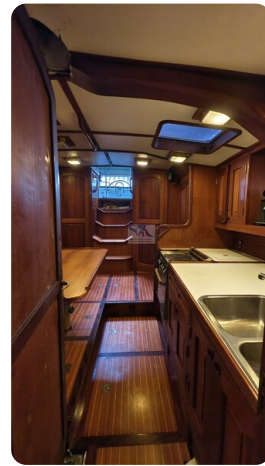
Feltz Alu One Off_61