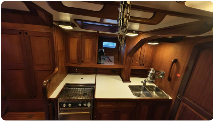
Feltz Alu One Off_53