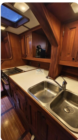
Feltz Alu One Off_66