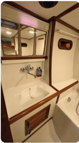
Feltz Alu One Off_60